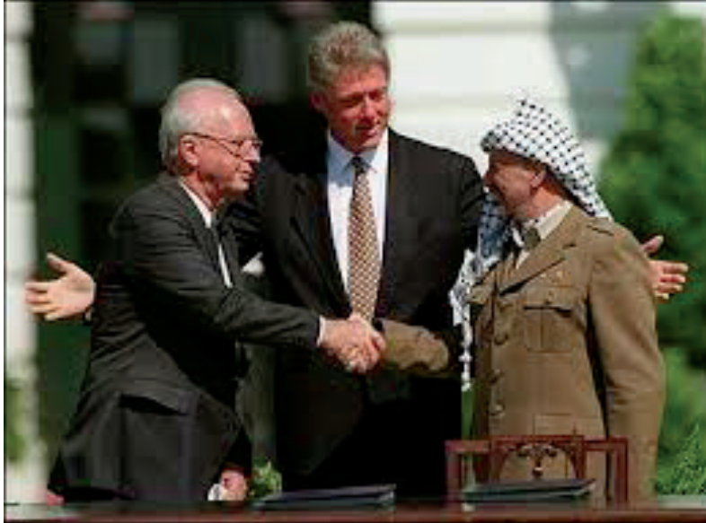
Acuerdos de Oslo, 1993, en la Casa Blanca, bajo auspicio del presidente Bill Clinton, y firmados por el entonces primer ministro israelí, Isaac Rabin, y el líder palestino Yassir Arafat.

final en que tuviera lugar el apretón de manos tradicional, en el que fue el líder árabe el que dio el primer paso en tenderla 12 .