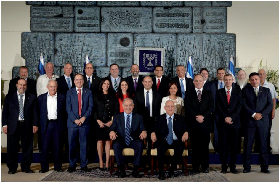
Actual gobierno, formado en marzo de 2015, con Benjamín Netanyahu en el centro junto al presidente Reuven Rivlin.

La narrativa de la derecha israelí, se basa fundamentalmente en la priorización de la seguridad por encima de todo, de modo que las iniciativas para emprender el proceso de paz con los palestinos pasa a un segundo plano, por no decir al último.