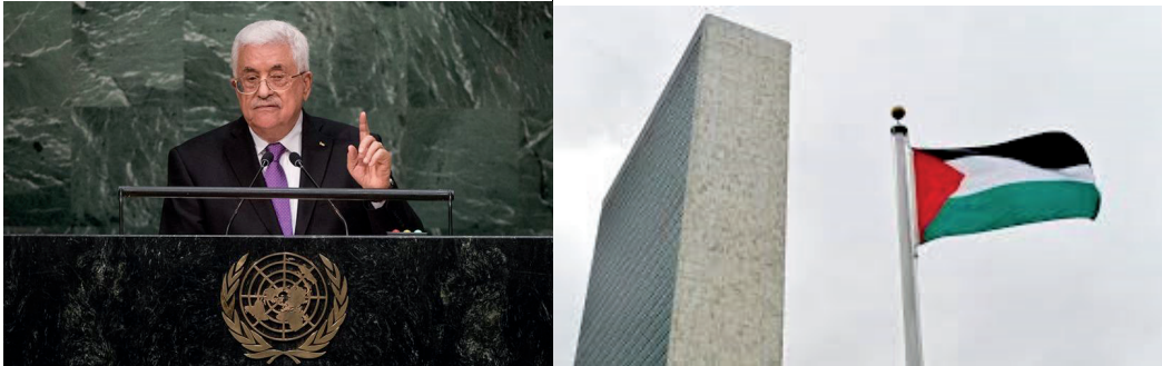
Mahmoud Abbas, en su primer discurso ante la Asamblea General de la ONU, el 30SEP15, y la bandera palestina ondeando por primera vez en la ONU.

de la Haya, aprovechando que también han sido aceptados como miembros en esta institución 74 .