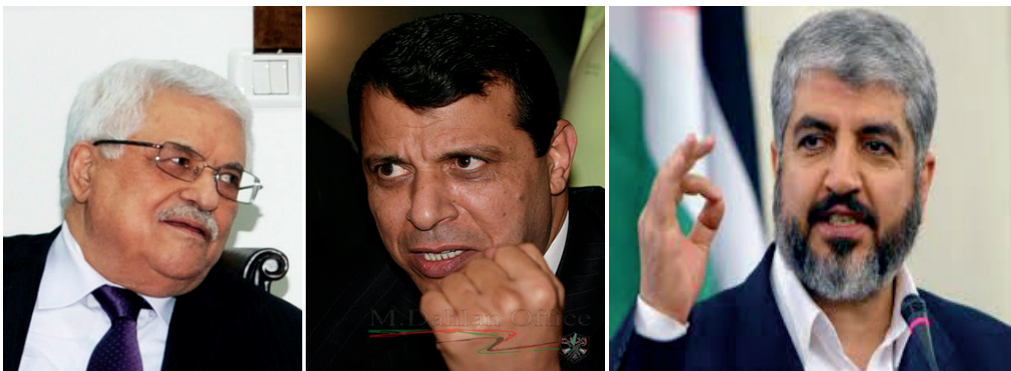
Mahmoud Abbas y Mohamed Dahlan, en el centro, ambos enfrentados por el control político por parte de Fatah en la franja de Gaza, ante el delirio de HAMAS, cuyo líder es Khaled Merchaal, en la foto de la derecha, y que actualmente reside en Doha, Qatar.

Es evidente que la ANP solamente gobierna en Cisjordania, y no en Gaza, pues no está interesada en asumir el control de esta zona tan convulsa, en particular lo que concierne a la seguridad. Abbas teme que si asume dicho control esto le suponga un desgaste que vaya en beneficio de Hamas y esta aproveche para hacerse más fuerte en Cisjordania. A ello se ha de añadir que los israelíes hacen lo posible para alimentar el alejamiento entre las dos subentidades palestinas, ya que ello le conviene al obstaculizar este hecho el establecimiento del estado palestino que tanto quiere impedir Israel.