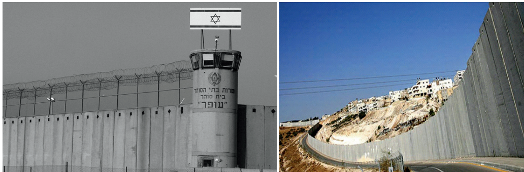
Imágenes del muro de separación entre Cisjordania e Israel, y que no coincide con la “línea verde”.

Sharon, en el 2003, comenzó a plantear un cambio de estrategia, que no fuera incompatible con la «hoja de ruta», con el objeto de ir adoptando una política de separación de los palestinos para aplicar una serie de medidas unilaterales entre las se encontraba la retirada total de la franja de Gaza, considerada como un lastre para Israel, y el desmantelamiento simbólico de algunos asentamientos de Cisjordania 33 . Con estas acciones Sharon transmitiría a la comunidad internacional, en especial al «cuarteto» 34 , su intención de contribuir decisivamente a la paz al ir retirándose de los territorios ocupados. Además, con ello trasladaba la responsabilidad de la seguridad en Gaza a los palestinos, que ya se sabía que tenían importantes disensiones entre Hamas y la ANP.