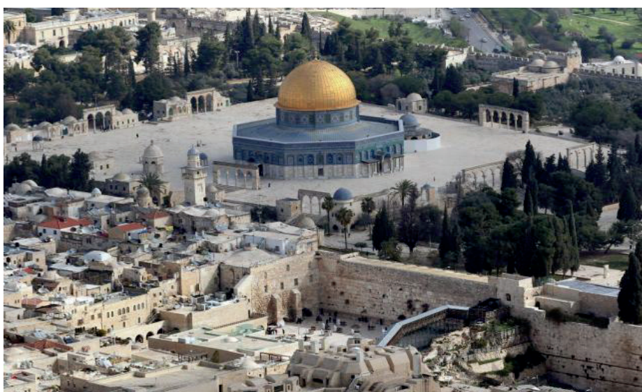
El tercer lugar santo del Islam, el “Haram al-Sharif”, donde se encuentran la mezquita de la Roca y la de Al-Aqsa, desde la cúpula dorada de la roca el profeta ascendió a los cielos.

En esta sempiterna confrontación, el factor religioso siempre ha jugado un papel relevante, donde la simbología adquiere una especial importancia, en particular aquella referida al estatus de la famosa explanada de las mezquitas, el «Haram al-Sharif» para los musulmanes, y el «Templo de Sion», «Har Habait» (en hebreo) para los judíos, uno de los nudos gordianos de este conflicto de más de sesenta años y un lugar que ambas comunidades reclaman como suyo y se niegan a ceder su soberanía sobre este santo emplazamiento para ambas religiones 46 .