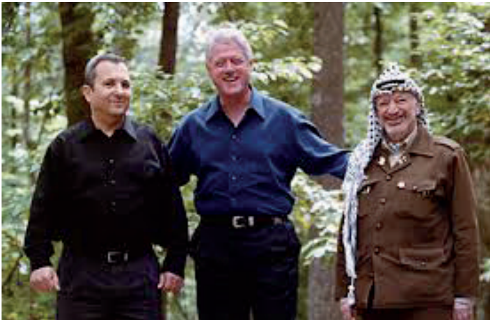
Julio de 2000, cumbre de paz en Camp David entre el primer ministro Ehud Barak y Yassir Arafat, con el presidente Clinton como sponsor e impulsor.

Arafat se mostró totalmente inflexible sobre cualquier posibilidad de concesión de soberanía sobre la explanada 23 , y no aceptaría nada que fuera en contra del total control palestino de Jerusalén este. Clinton era consciente que ello era igualmente inaceptable para el primer ministro.