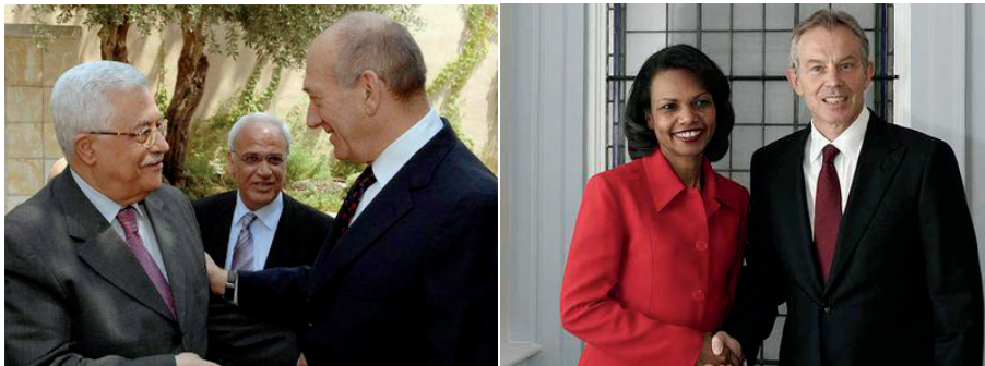
A la izquierda, Mahmoud Abbas y Ehud Olmert en la cumbre de Annapolis, en el centro, Saaeb Erekat, el principal negociador de la ANP. En la foto de la derecha, dos representantes del “cuarteto”, la secretaria de estado norteamericana, Condoleezza Rice, y el representante de la UE para el conflicto palestino - israelí, el ex primer ministro británico Tony Blair.

obtener en esta ocasión 37 . La conferencia despertó muy escaso entusiasmo en la sociedad palestina y son muy pocos en los territorios ocupados los que valoran un proceso de paz interminable, que no acaba de materializarse en la mejora de sus condiciones de vida y que no consolida un Estado palestino viable en una Cisjordania totalmente discontinua por el aumento de los asentamientos israelíes, unidos por una red tupida de carreteras vigiladas y controladas por las fuerza de seguridad judías. Además, Hamas ya había establecido un gobierno en Gaza independiente de la ANP, aparte de expulsar de la franja a aquellas milicias afines a Fatah.