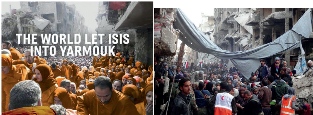
Imágenes del campo de refugiados en Yarmouk, en un barrio en ruinas de Damasco, en la foto de la derecha se puede observar a los miembros de las ONGs.

A ello se añade la diferente percepción de los refugiados en el propio pueblo palestino, entre las poblaciones de Gaza o Cisjordania, y entre la misma diáspora, pues no es lo mismo ser refugiado en Jordania que en Líbano o en Siria 51 , donde están siendo víctimas del largo y terrible conflicto que asola este país y se encuentran en condiciones mucho peores 52 . Opinan de manera distinta los propios refugiados de aquellos que no lo son, pues estos últimos no sienten el prejuicio que supone el hecho de encontrarse en un país y una tierra que no es la suya.