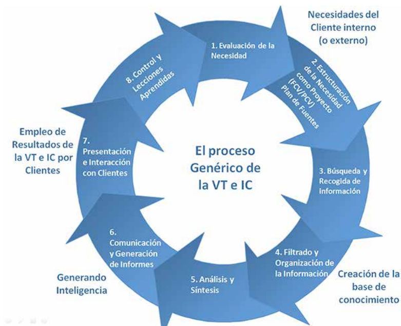
Figura 4.1. Proceso o ciclo genérico de la Inteligencia Competitiva

en paralelo e interacciones que permiten acortar los tiempos de entrega que implicarían un proceso estrictamente secuencial de estas etapas.