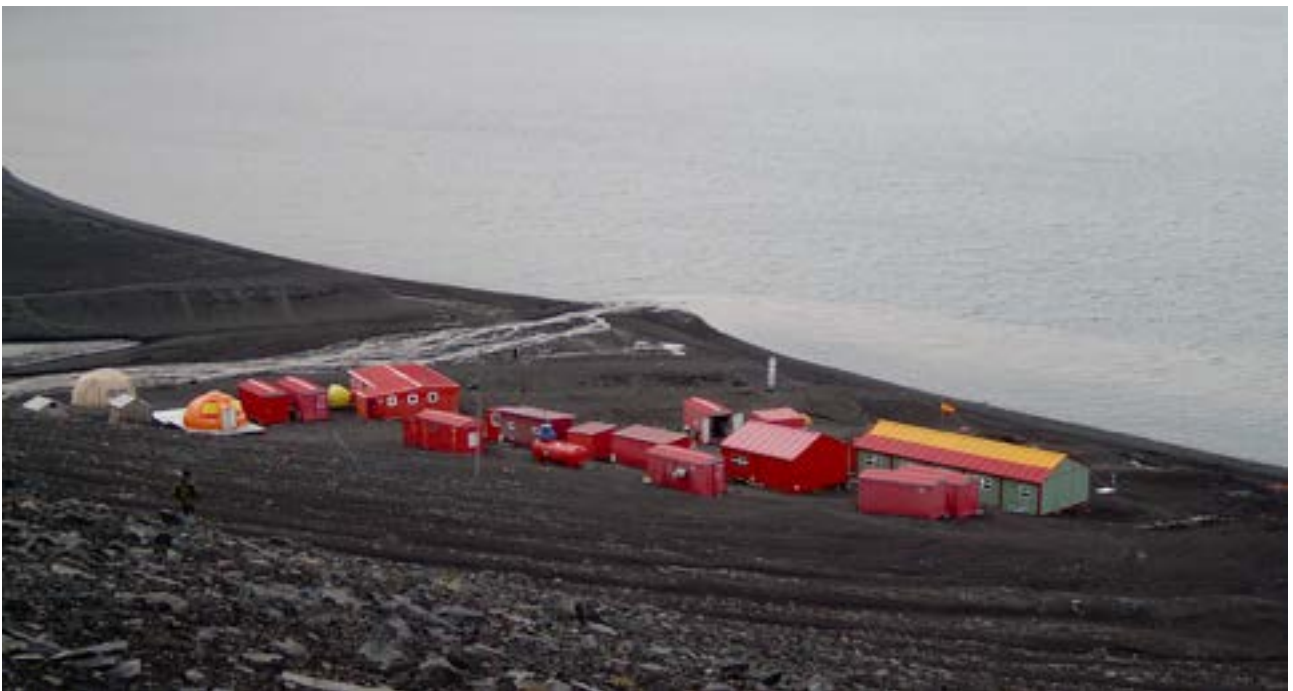
La base antártica es una de las 111 instalaciones que disponen de Sistema de Gestión Ambiental

Actualmente, el Ejército de Tierra dispone de 54 Sistemas de Gestión Ambiental en un total de 111 instalaciones, entre las que se encuentra la Base Antártica Española “Gabriel de Castilla”, única certificada por la normativa internacional ISO 14.001 en el exterior. Muchas de ellas se encuentran