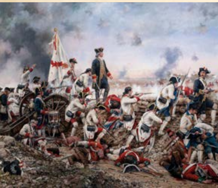
Augusto Ferrer-Dalmau ilustró la batalla de Pensacola, en la que Balmis participó como cirujano militar

Aprovechó para depositar en el Jardín Botánico de Madrid algunas muestras de plantas (como la begonia) para analizar sus propiedades; e investigó la cura contra la sífilis. «Balmis se caracterizó por su temperamento vehemente y el deseo de resolver las cosas; era un hombre con ca-