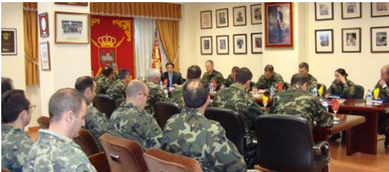
Los cursos contribuyen a la formación y la concienciación del personal de las unidades

en los que se realizan ejercicios con mayor riesgo de fuego, hay Planes Técnicos de Defensa Contra Incendios Forestales.