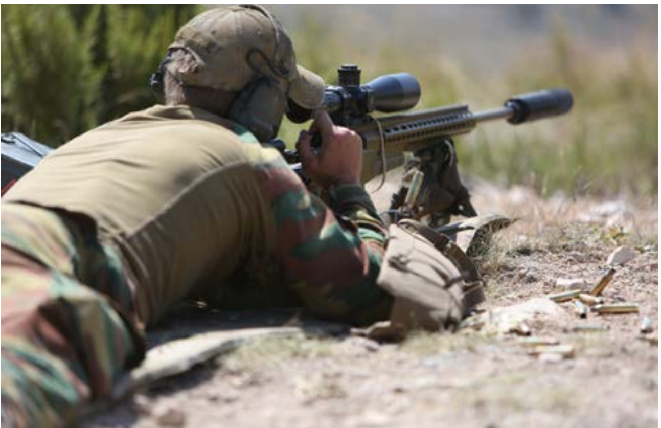
La precisión a largas distancias es un reto que las condiciones de "Chinchilla" permiten poner a prueba