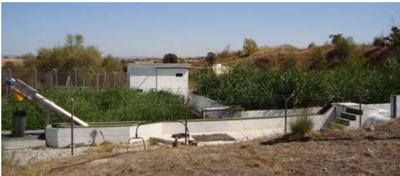
Estación Depuradora de Aguas Residuales de "El Goloso", con filtro de plantas macrófitas

en zonas de especial protección, lo que requiere de una mayor implicación para preservar los espacios naturales.