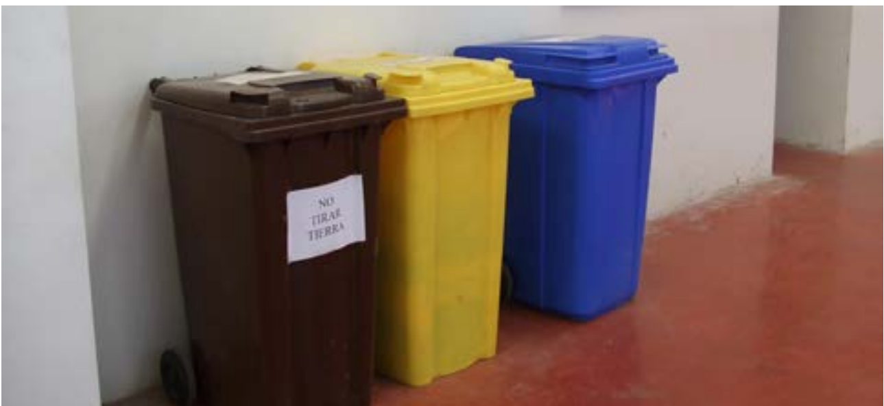
Los tipos de residuos que se generan son muy variados y tienen que ser separados adecuadamente

Uno de los grandes riesgos para estas especies son los incendios que afectan al medio natural. Para ello, el Ministerio cuenta con Planes de Defensa Contra Incendios Forestales y, en aquellos lugares