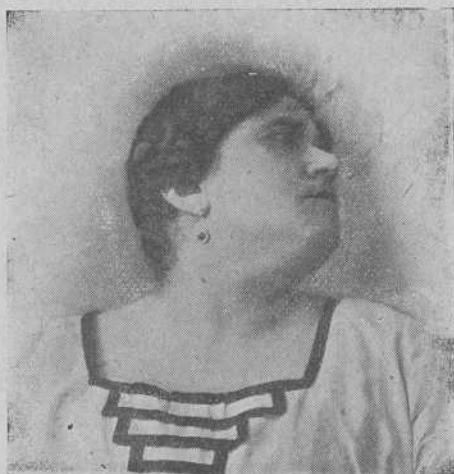
Fig. 4. a —Retro latero-torticollis de Brissaud. (3. a Historia clínica.)

Explorada, compruebo en ella que el cuello se halla fuertemente inclinado hacia el lado izquierdo y hacia atrás, siendo atacado de cuando en cuando por algunos ligeros movimientos convulsionantes, todo lo cual la origina una actitud deforme que resiste fuertemente a toda corrección violenta (véase foto núm. 4).