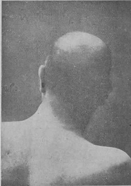
Fig. 2. a —El enfermo de la historia primera visto de espaldas al mes de tratamiento.

El Torticolis mental de Brissaud , que debe su nombre a este ilustre psiquiatra francés, es enfermedad que, por encima de los quince años, puede aparecer en todas las edades; que necesita siempre para producirse una predisposición mental de carácter obsesivo , que toma su origen en la patoherencia psiconerviosa , y en una causa próxima eficiente, que casi siempre pasa inadvertida para el sujeto, pero que insistiendo en el interrogatorio, siempre