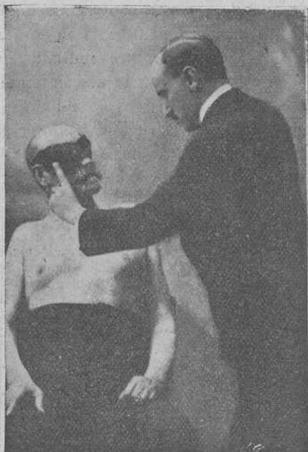
Fig. 3. a —Una sesión de reeducación psicomotriz.

Con estos dos factores, predisposición mental y hábito adquirido hacia una actitud viciosa inicial o hacia un brusco y repetido movimiento de defensa, no tarda en llegar a crearse en la mentali-