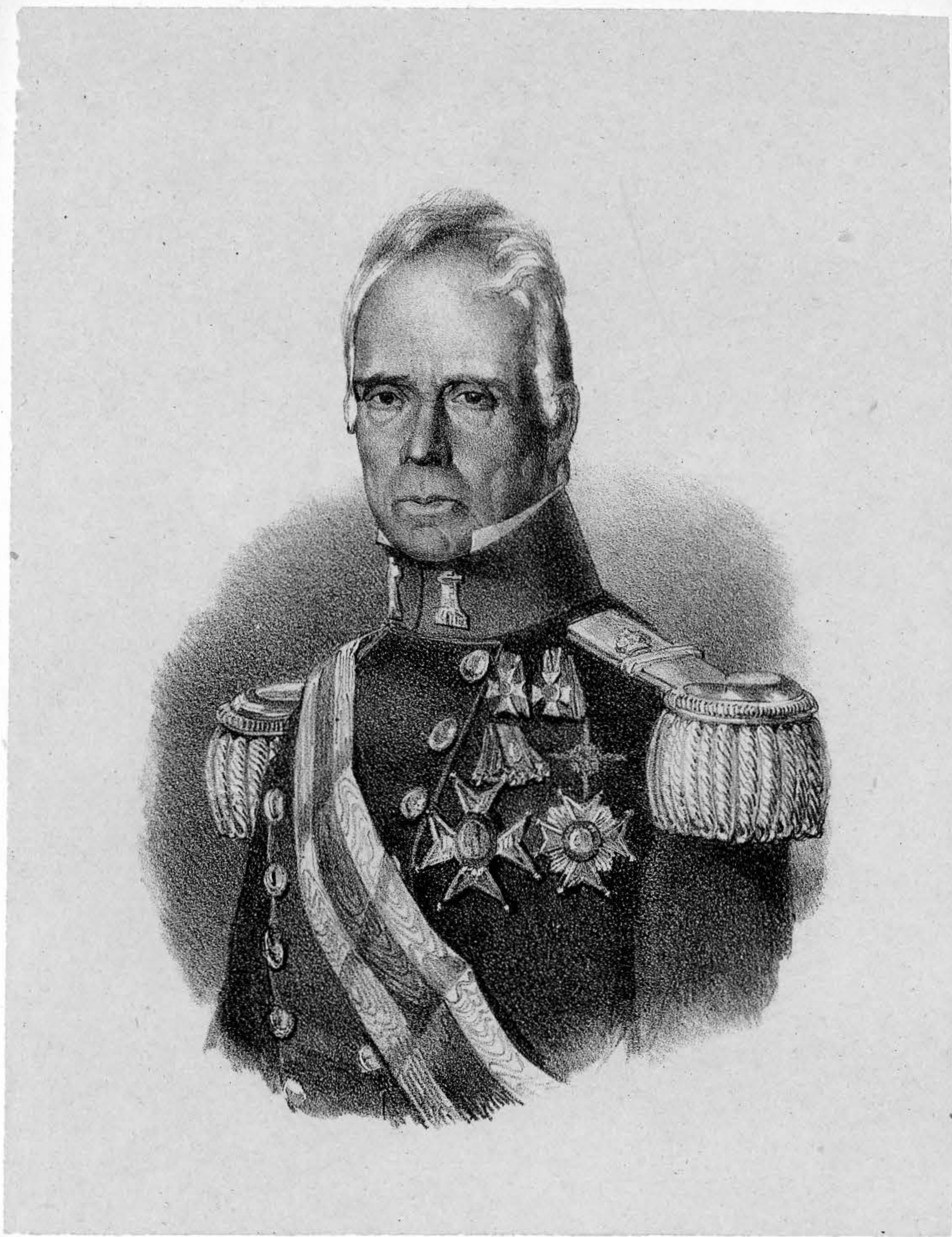
EL TEN TE GEN L D N GASPAR DIRUEL COR L QUE FUE DEL REG TO DE ING S FALLECIO EN 27 DE D BRE DE 1854

Hizo por su testamento una donacion perpetua para premiar anual- mente en los indiv S mas benemeritos de las clases inferiores de tropa, la buena conducta, subordinacion y disciplina.