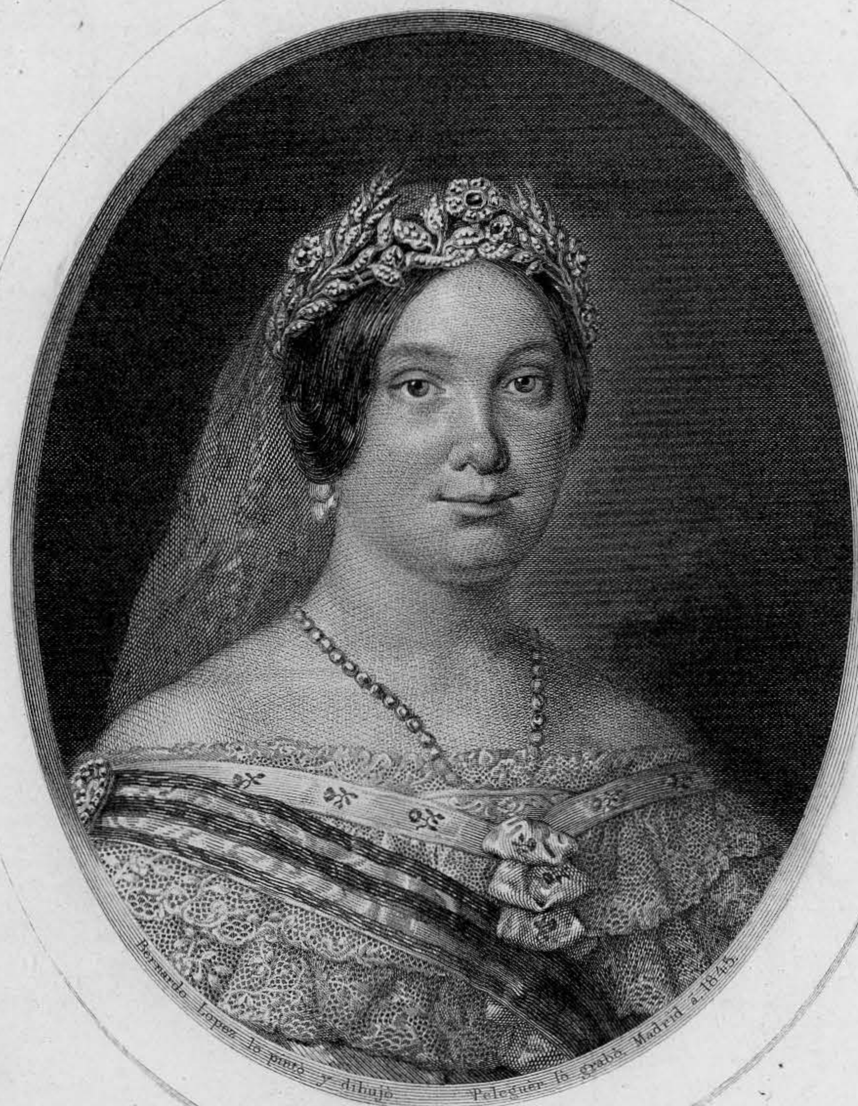
ISABEL II. REINA DE LAS ESPAÑAS.