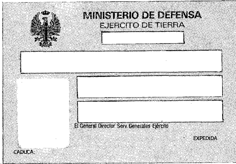
(B) Reverso de la Tarjeta