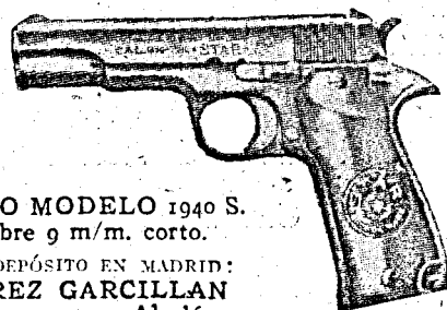
NUEVO MODELO 1940 S. Calibre 9 m/m. corto.