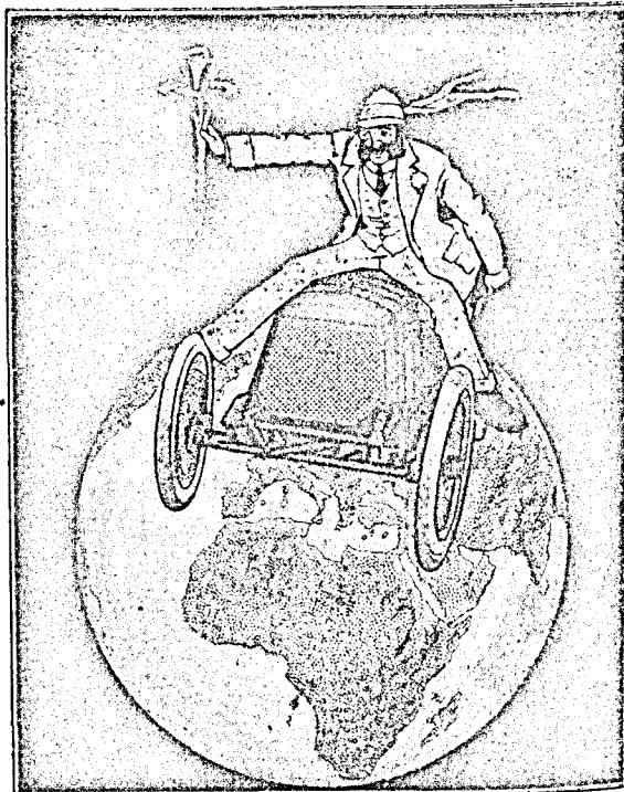
ELIAS RIZO - Azafranes, anís en grano, cominos y otros productos. - NOVELDA (Alicante)

ALVEAR VINOS y CONACS DELEGACION GENERAL ACADEMIA, 6 - Tfnos. 265 29 19 391 - MADRID