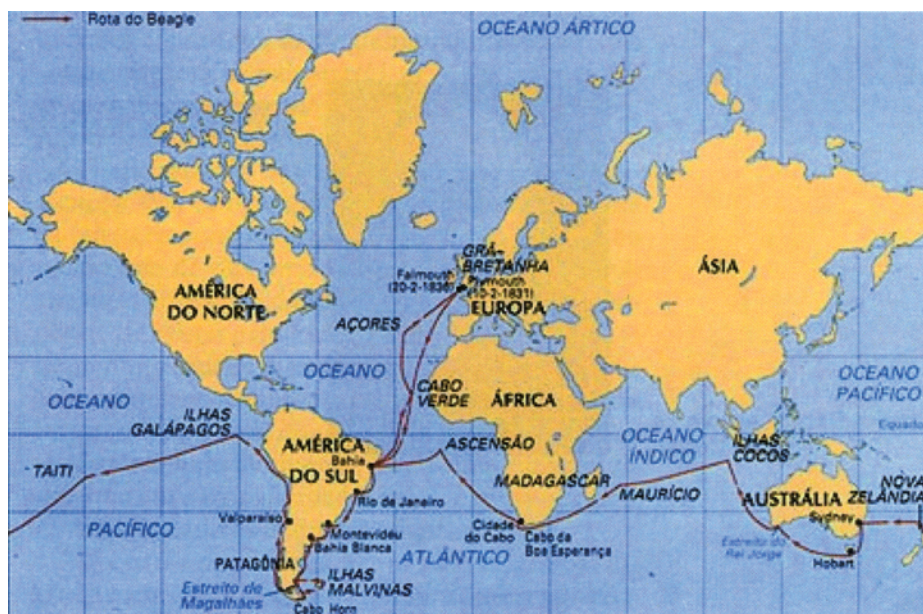
El viaje de Darwin a bordo del Beagle .

Los primeros días a bordo fueron poco alentadores; no era un hombre de mar, se mareaba con frecuencia y detestaba la función encomendada de acompañante de Fitz Roy. Las normas de la Armada británica impedía al comandante del buque alternar con la dotación. La primera escala del Beagle fue en Tenerife donde una epidemia (la isla estaba en cuarentena), le privó de su actividad exploradora. Navegando rumbo al archipiélago de Cabo Verde, cruzaron el paralelo cero grados (ecuador) llegando a las costas sudamericanas de Salvador de Bahía a finales de febrero. La impresión que recibió Darwin a su llegada fue impresionante. En su diario escribe: «la palabra dichoso es harto débil para expresar los sentimientos de un naturalista que por vez primerar vaga por un bosque brasileño». Fue enorme la satisfacción que le produjo el contacto con las plantas salvajes, la hermosura de las flores y, la variedad y cantidad de insectos existentes.