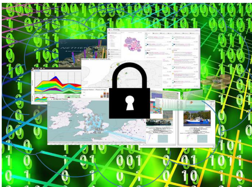
Fig. 2. Imagen de la actividad IST-133 sobre analítica visual aplicada a la ciberdefensa.

Constituye, en definitiva, una manera muy interesante de promover el desarrollo de una tecnología que está llamada a tomar cada vez una mayor relevancia en las soluciones tecnológicas de gestión de datos e información, en particular en el ámbito de defensa y seguridad.