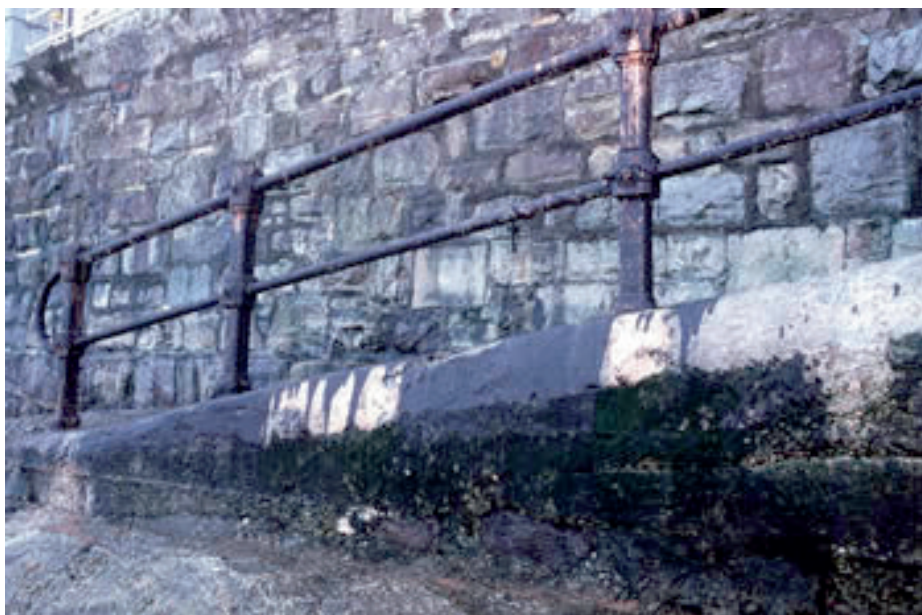
Restos de fuel-oil del Castillo de Salas en una escalera de acceso a la playa de San Lorenzo de Gijón.

Ahora bien, «si los contratistas cumplen y terminan este contrato dentro de los 180 días naturales de(sde) su firma, los armadores pagarán a los contratistas una cantidad extra de un 20 por 100 sobre la cantidad fijada a pagar». Y aunque el contrato contemplaba otros plazos eventuales, al final Fondomar acabó la obra antes de dichos seis meses y cobró el incremento previsto: en total, 187 millones de pesetas. Como luego veremos, Fondomar facturó como obra terminada y completa lo que solo fue una remoción parcial de la popa y una eliminación menor de sus combustibles. En suma, se primó la incompetencia.