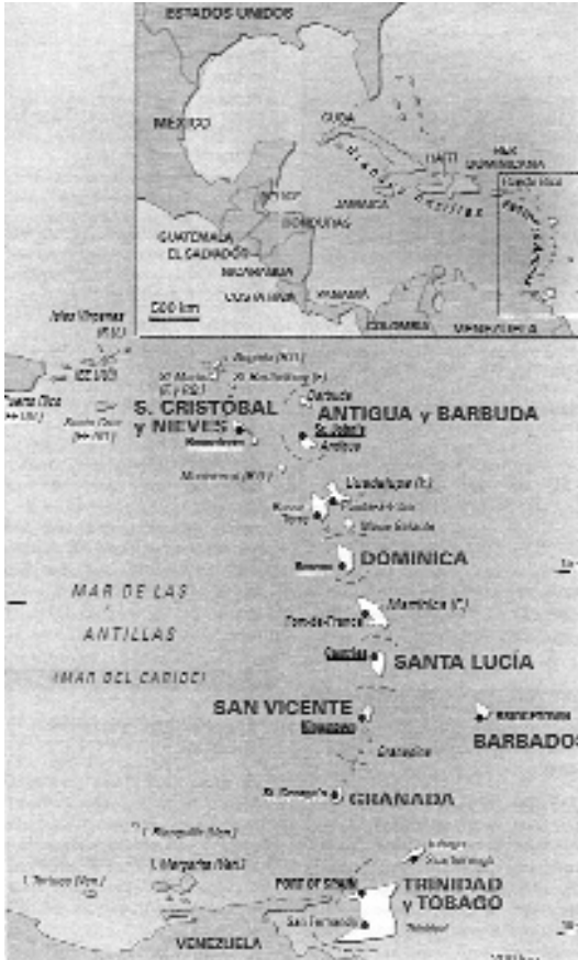
Las Pequeñas Antillas.

llas» que en forma de barreda arqueada se extienden desde el este de la de Puerto Rico hasta la isla de Trinidad próxima a la costa oriental venezolana.