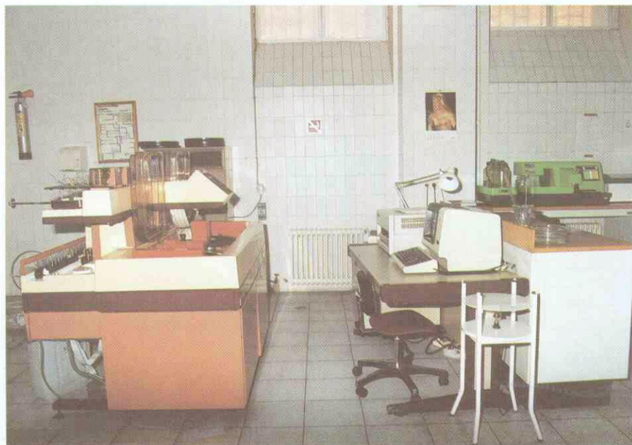
Foto 4. — El trabajo con el ordenador en el Servicio es absolutamente necesario.

A medida que se iban introduciendo datos se hacía notar que el impreso que diariamente rellenamos, el PARTE DIARIO, carecía de la estructura necesaria para poder llevar un control informático suficientemente preciso de sus datos. Entonces se consideró que era preciso realizar una serie de modificaciones para dar más información en el mismo espacio y que al mismo tiempo dicha información resultase inteligible. (Figura 1).