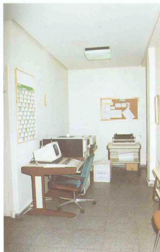
Foto 3. — Ordenador PDP.II. utilizado en los Servicios Administrativos de la 1.ª Planta de la Sección Central.

relación, comienzan por el dígito "4". (Figura 2).