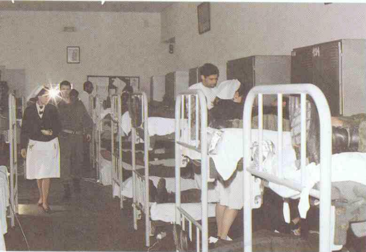
Foto 1. — Damas de Sanidad Militar en una colecta realizada en una Unidad.