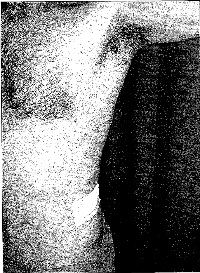
Figura 1: Lesiones papulo-necróticas en tórax anterior y raíz de miembros superiores.