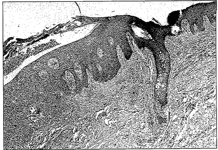
Figuras 3 y 4: Descrietas en texto.