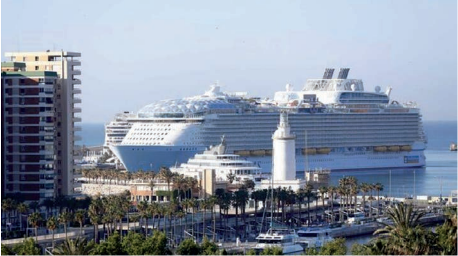
El transatlántico Wonder of the Seas atracado en el puerto de Málaga, abril 2022.