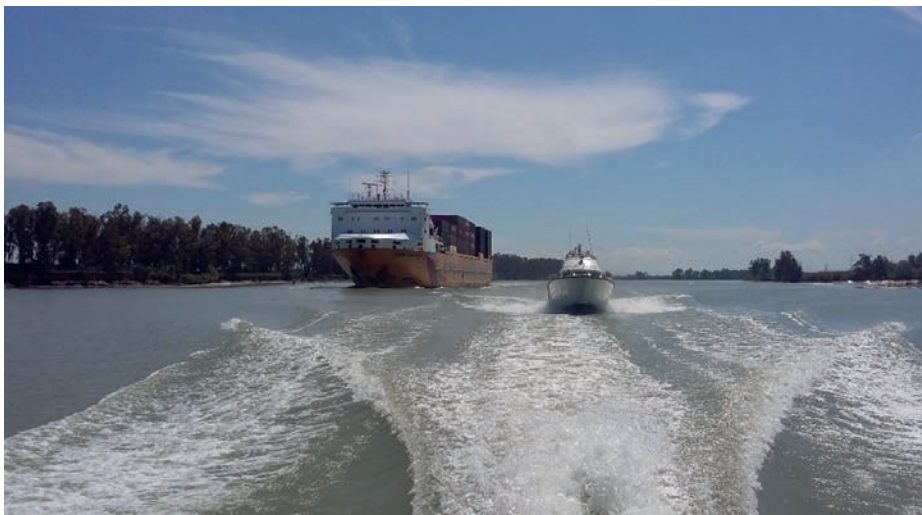
LHT Astrolabio en campaña hidrográfica en el río Guadalquivir.