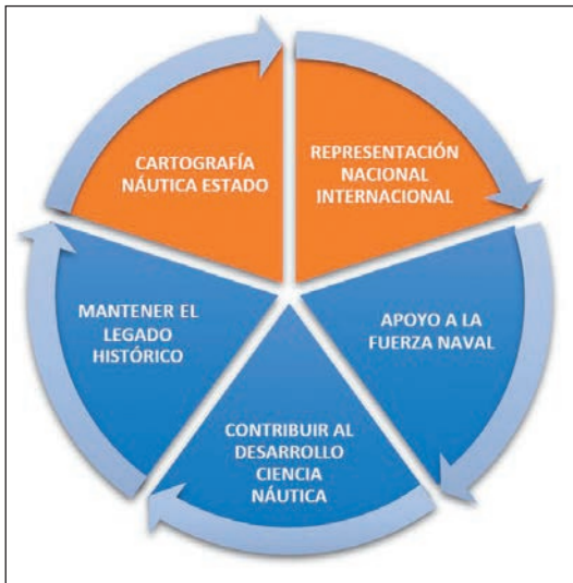
Misiones del IHM. (Elaboración propia)

Las tres misiones restantes, como son el apoyo a la fuerza naval, contribuir al desarrollo de la ciencia náutica y mantener el legado histórico, derivan de su naturaleza como unidad de la Armada.