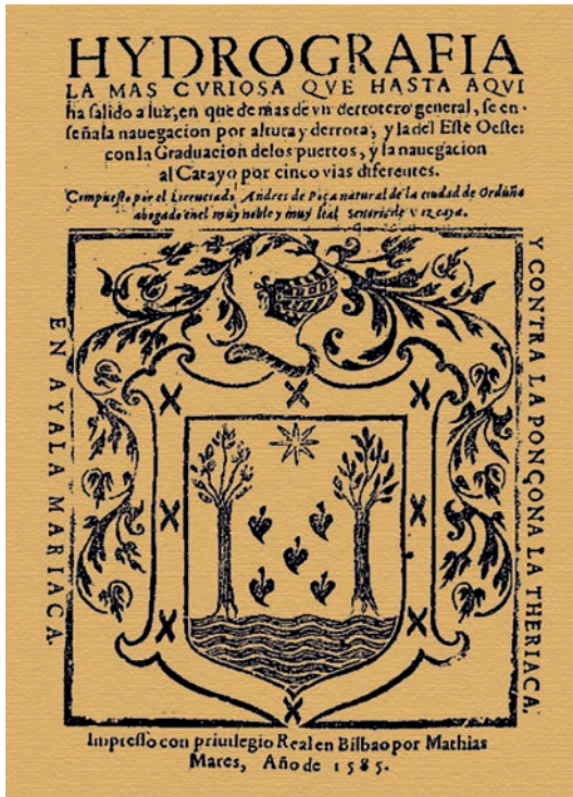
Hydrografia , de Andrés de Poza (1585).

Se puede establecer que los orígenes del IHM están ligados a la actividad cartográfica de la Casa de la Contratación, institución creada por los Reyes Católicos en Sevilla en 1503 para controlar el comercio y la navegación al Nuevo Mundo. Allí se fueron confeccionando las cartas de las nuevas tierras, pudiendo ser considerada, además de la primera universidad náutica, el primer organismo coordinador y productor de cartografía náutica de forma oficial y organizada.