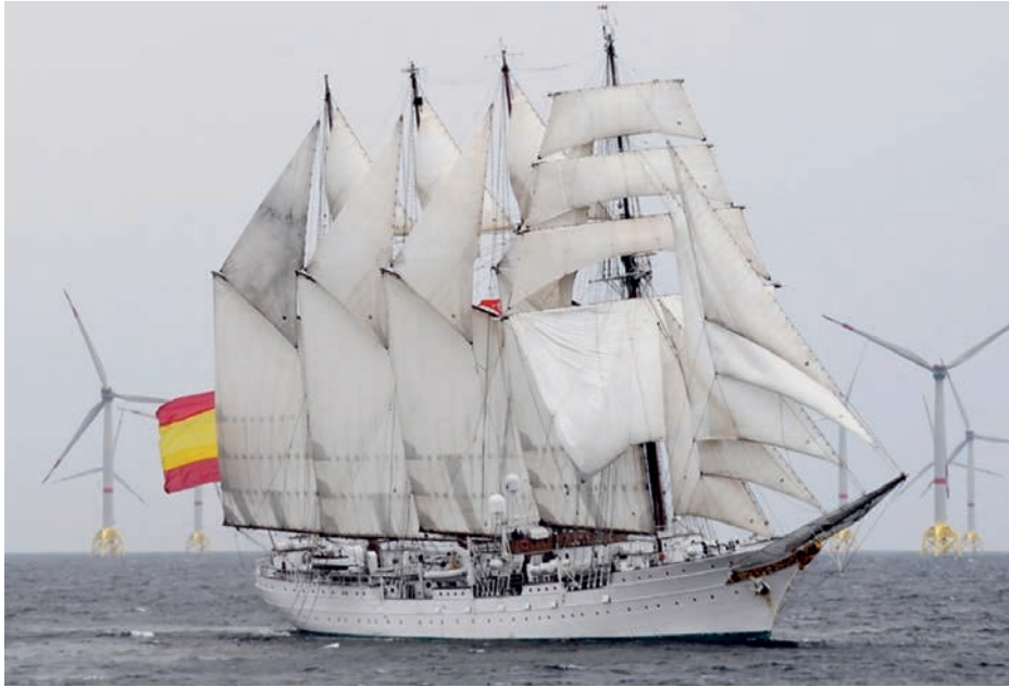
El buque escuela Juan Sebastián de Elcano navegando junto al parque eólico Wiking, en Alemania, junio de 2019.

producción de oxígeno y de desove de peces. Igualmente, desempeña un papel importante en la prevención de la contaminación, delimitando fuentes contaminantes y zonas de vertido ilegales, lo que permite establecer áreas de protección o de acceso restringido.