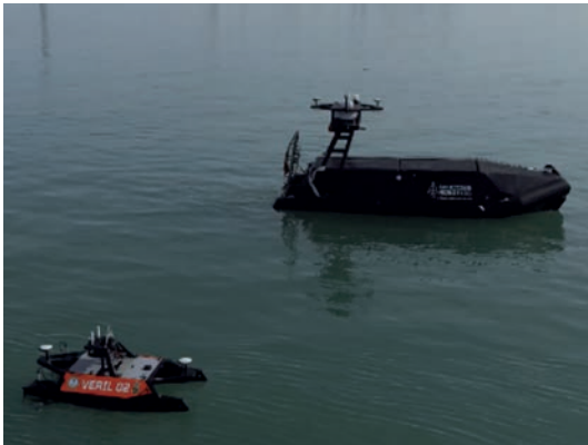
Vehículos autónomos trabajando simultáneamente en la dársena de la Base Naval de Puntales.

Los nuevos buques hidrográficos son ya una realidad. El pasado 20 de diciembre de 2023, el Ministerio de Defensa y Navantia firmaron la orden de ejecución de dos buques hidrográficos costeros como primer paso para la renovación de una flotilla hidrográfica cuyas principales unidades rondan el medio siglo de vida.