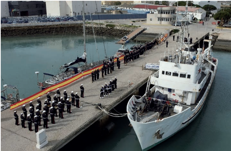
Acto de baja en la Armada del buque hidrográfico Antares , 18 de febrero de 2024.