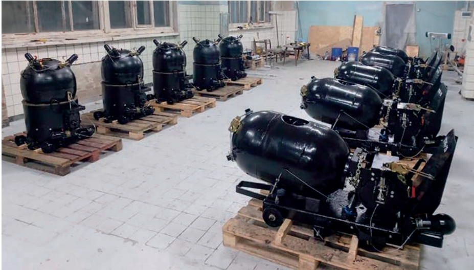
Minas YaM y KPM ucranianas tras su modernización en 2020.