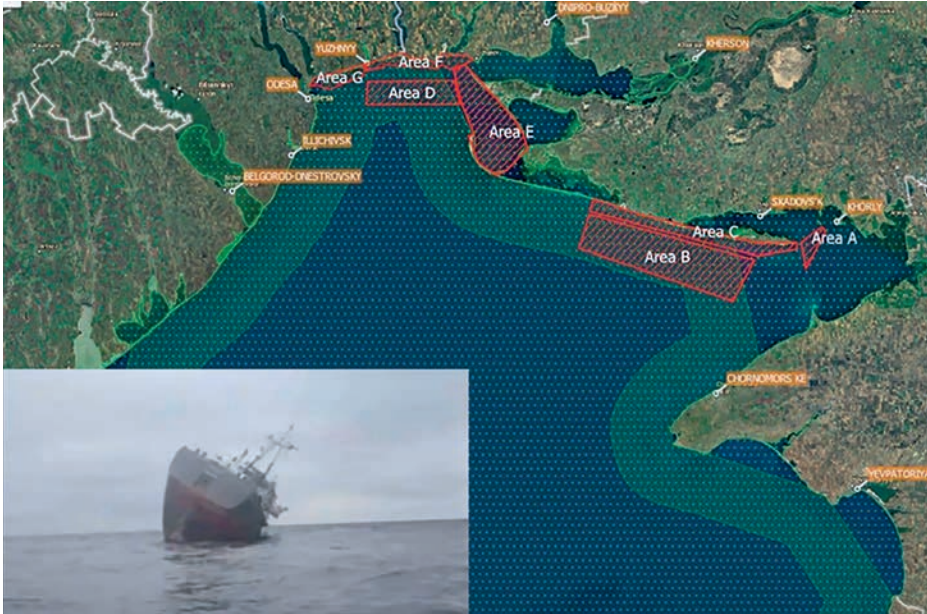
Áreas declaradas minadas por Ucrania y el MV Helt hundiéndose.