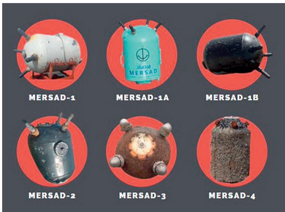
Variantes de la mina de contacto hutí Mersad.

Aunque el riesgo de minas navales en este conflicto hasta ahora parece limitado debido a la proximidad de los campos minados a la costa y por el explosivo relativamente pequeño de las Mersad, esta suposición pudiera ser errónea, ya que los hutíes cuentan además con minas de fondo de influencia de origen ruso AMD-500 (450 kg equivalentes en TNT) y DM-1 (1.125 kg equivalentes en TNT). El peligro generado por éstas es muy superior al de las Mersad, pudiendo ser fondeadas hasta los 125 m de sonda.