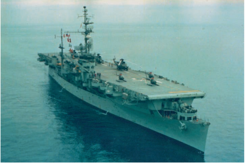
Portaeronaes Dédalo .

—Por lo que yo sé, no se necesita más tiempo —respondí orgulloso de la eficacia de nuestra organización—. Como hay suficientes turbinas de repuesto en el almacén y resulta fácil localizarlas, ya que su contenido está informatizado, el tiempo necesario se reduce al de su carga a bordo, al del viaje y el que requiera el trabajo de los mecánicos.