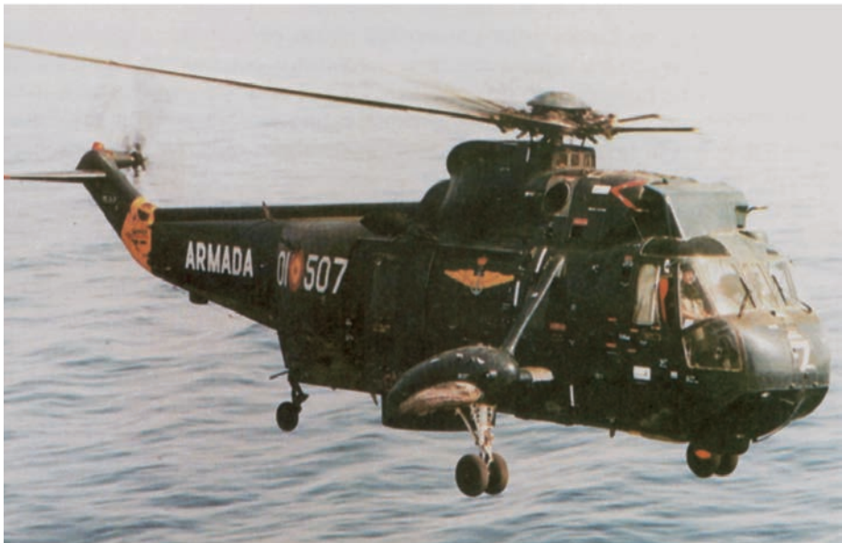
Helicóptero SH-3D volando sobre la mar. Sobre la cabina se puede apreciar el escudo antihielo.

—A la vista de lo ocurrido —me dijo el jefe—, quedas emplazado para que en la reunión de mañana nos expliques en detalle los hechos. Será una experiencia importante que has de compartir con todos nosotros, ya que es la primera vez que un piloto de la escuadrilla pasa por esa situación.