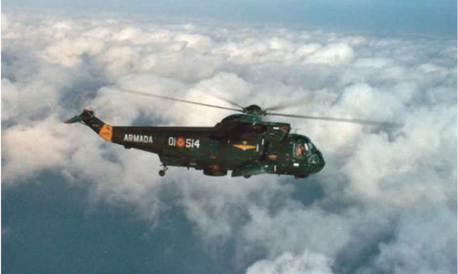
Helicóptero SH-3D Sea King volando sobre nubes. El fuselaje está pintado con los antiguos colores y distintivos.

Volando en tales circunstancias, observamos que ligeros copos de aguanieve caían sobre los cristales delanteros. Para evitar que se adhirieran a su superficie, tratamos de desprenderlos por medio del continuo barrido de las escobillas limpiaparabrisas. Sin embargo, la medida no pareció ser suficiente, ya que varios minutos después observamos cómo comenzaba a acumularse escarcha en la parte inferior de ambos cristales parabrisas, en los lugares donde no alcanzaba el barrido. Gradualmente, la escarcha se fue haciendo más densa hasta convertirse en hielo. De repente, uno de aquellos bloques de hielo, el correspondiente al cristal derecho, se desprendió y salió despedido hacia arriba, con la mala suerte de que se lo tragó la turbina número 2.