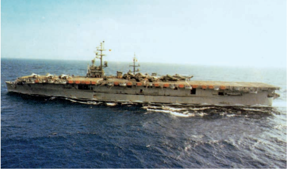
Portaeronaes Dédalo con aviones Harrier y helicópteros SH-D sobre la cubierta.

dos suboficiales — que formábamos la tripulación del helicóptero. Mientras él disponía el hospedaje solicitado, me puse en comunicación telefónica con el jefe de Escuadrilla, que esperaba en su domicilio la novedad del final del vuelo nocturno. Le conté lo que nos había sucedido con la parada de la turbina por ingestión de hielo. Como ésta había quedado fuera de servicio, me dijo que a la mañana siguiente organizaría todo para que fuese sustituida, pero que no obstante le llamase a primera hora para confirmar los detalles.