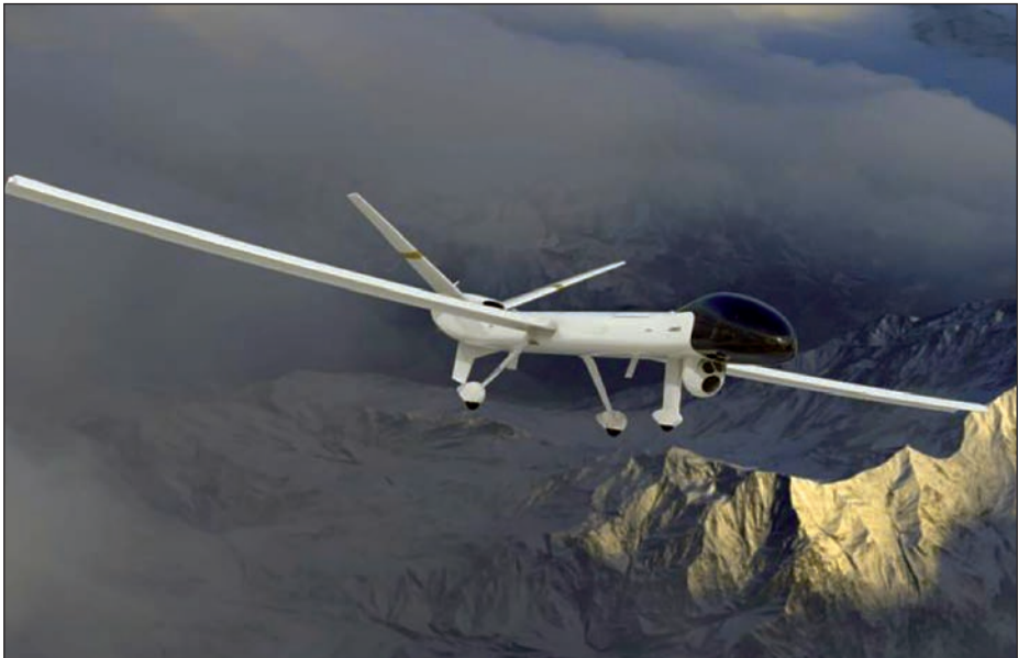
El SIRTAP de Airbus podría incorporar tecnologías como MAVEN (6)

Los algoritmos de reconocimiento de imágenes con bases en la IA podrían suponer un catalizador para sistemas como el nuevo SIRTAP (Sistema Remotamente Tripulado de Altas Prestaciones) de Airbus, recientemente adquirido por el Ministerio de Defensa español (5).