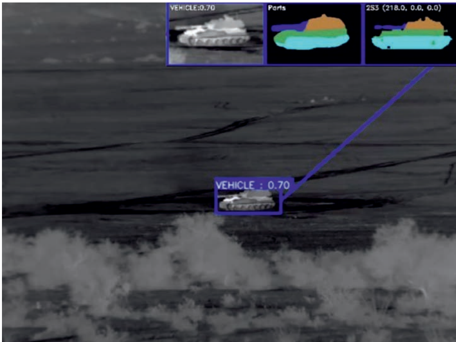
Ejemplo del sistema ATLAS de reconocimiento de plataformas (2)