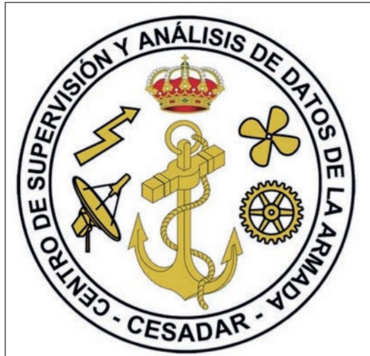
Escudo del CESADAR

El mantenimiento predictivo asistido por IA en el ámbito militar no sólo mejora la eficiencia y reduce costos, sino que también juega un papel vital en garantizar la operatividad y la eficacia de los sistemas de armas modernos. Las tecnologías como la realidad aumentada o el aprendizaje no supervisado, combinadas con el análisis de big data y sensores avanzados, abren nuevas posibilidades para mantener y mejorar la preparación de los equipos militares de manera proactiva y eficiente.