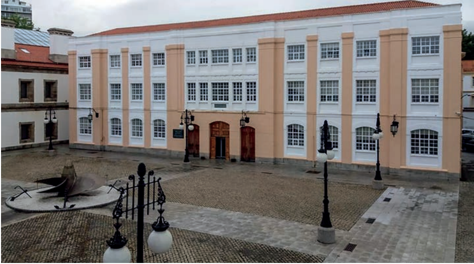
Sede del Organismo de Apoyo al Personal en Ferrol.

de las Secciones de Apoyo al Reclutamiento (SAR), subordinadas a los Organismos de Apoyo al Personal (OAP), y los Puntos de Información Naval (PIN), que están encuadrados orgánicamente en algunas comandancias navales bajo la dependencia funcional de la SAR del área geográfica correspondiente.