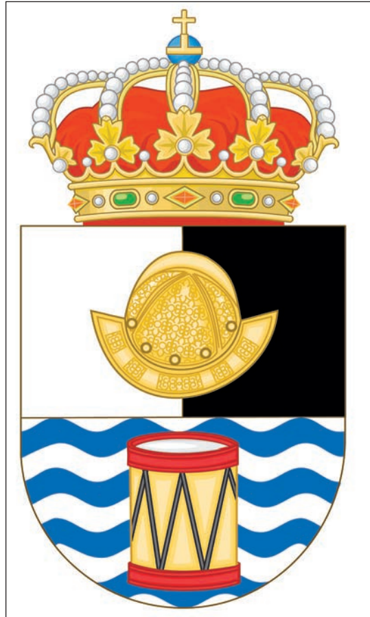
Escudo de la DIGEREM. Ministerio de Defensa.

La política de reclutamiento, tanto en su fase de información como en la de captación, es dirigida de manera centralizada por el Ministerio de Defensa. El Real Decreto 372/2020, de 18 de febrero, por el que se desarrolla la estructura orgánica básica del Ministerio de Defensa, establece que corresponde a la Subdirección General de Reclutamiento y Desarrollo Profesional de Personal Militar y Reservistas de Especial Disponibilidad, de la Dirección General de Reclutamiento y Enseñanza Militar (DIGEREM), dependiente de la Subsecretaría de Defensa, la implantación del Plan Permanente de Captación y Reclutamiento (11) en el ámbito del Ministerio de Defensa. El plan busca conseguir una mayor coordinación e integración de esfuerzos de los Ejércitos y la Armada con el fin de optimizar los recursos humanos, económicos y materiales disponibles, desarrollando acciones y actividades orientadas a la información en lo referente al ámbito profesional dentro de las Fuerzas Armadas y dirigidas al público general, así como a la posterior captación del personal.