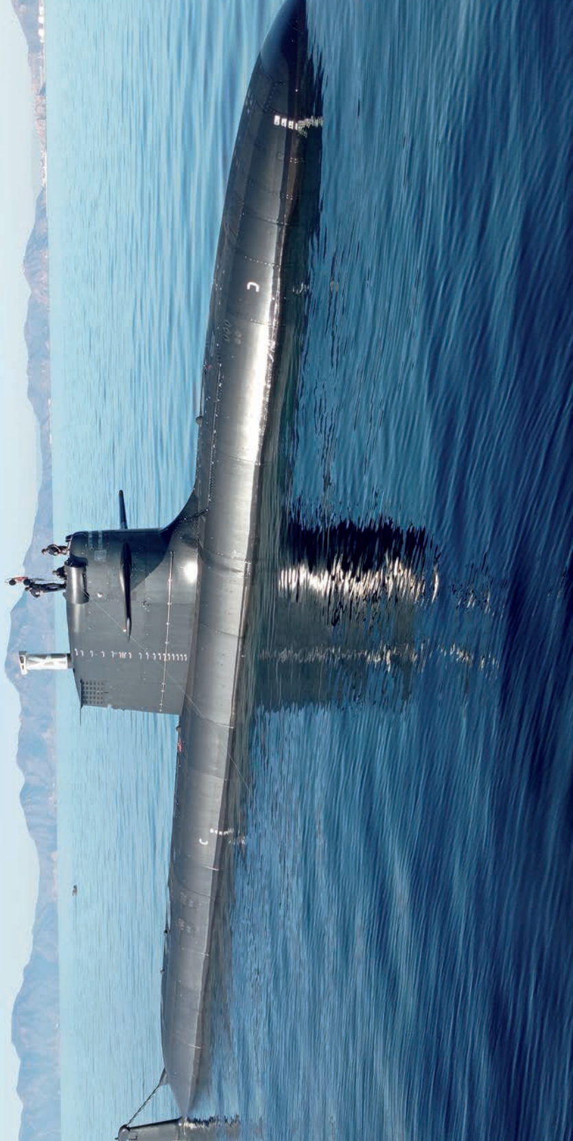
Submarino S-81 Isaac Peral realizando ejercicio de remolque con el BSR Neptuno .