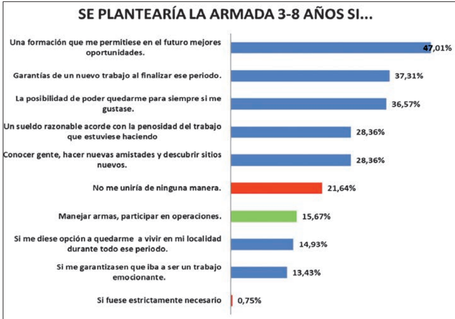
Figura 2. Razones por las que plantearse el ingreso como MPTM en la Armada. (Elaboración propia) (9)

Las principales conclusiones que podemos extraer es que apenas un 15 por 100 se decantaría por servir en la Armada por dos de los motivos más vocacionales que se les atribuyen a los militares, es decir, aquéllos relacionados con la participación en operaciones y con el manejo de las armas, bastante por debajo de los que declaran que no se unirían en ningún caso (casi un 22 por 100).