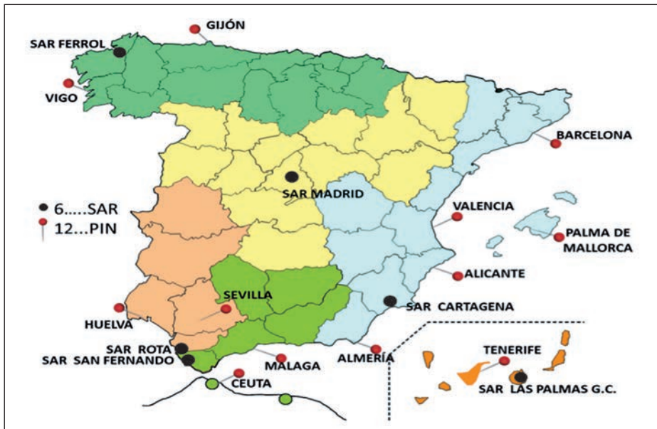
Figura 3. Localización de SAR y PIN en la geografía española.

Dentro de la estructura organizativa de la Armada, corresponde a la Sección de Reclutamiento de la Subdirección de Reclutamiento e Integración (SUBDIREC) la planificación y el desarrollo de todo lo relacionado con la política de reclutamiento, incluyendo las misiones de información y captación y la coordinación de todas las actividades que se llevan a cabo de manera efectiva a través de una organización periférica con dos tipos de unidades especialmente enfocadas a las tareas de información y captación (13). Hablamos