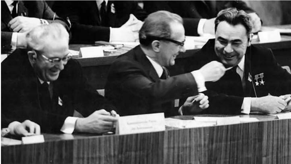
Yuri Andrópov, junto a Erich Honecker y Leonid Brézhnev.

alternativa: Moscú conocía el Able Archer, y los movimientos militares no estaban motivados por el pánico, sino por una demostración de fuerza. No pretende ser la interpretación definitiva, ya que muchas fuentes soviéticas continúan clasificadas y otras no se encuentran catalogadas en los países del antiguo Pacto de Varsovia. Sin embargo, puede ser un punto de partida para nuevas investigaciones.