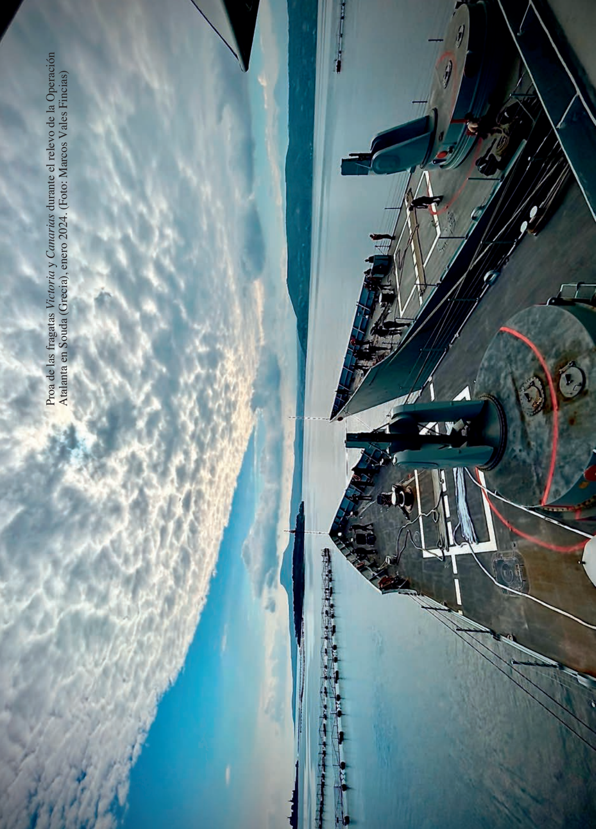
Proa de las fragatas Victoria y Canarias durante el relevo de la Operación Atalanta en Souda (Grecia), enero 2024.