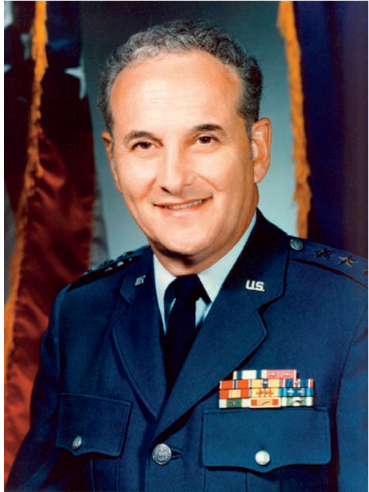
Leonard Harry Perroots.

Teóricamente, este panel pretendía comprobar los procedimientos utilizados para elaborar las estimaciones de inteligencia e identificar sus limitaciones para evaluar riesgos. En 1990 se presentó el memorando final. Con un nivel de clasificación por encima de top secret por la sensibilidad del material contenido y los métodos utilizados para obtenerlo, este trabajo siempre