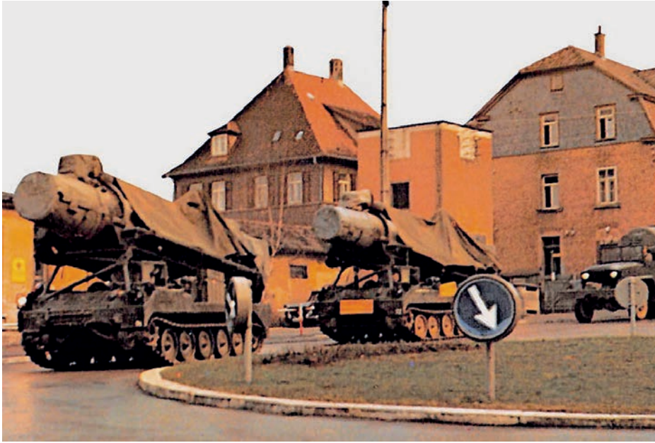
Misiles Perzhing-I en la República Federal de Alemania en 1969.

hasta finales de mes, el Kremlin desconocía con exactitud cuándo se desplegarían (30). Por estas razones, parece lógico que la inteligencia soviética también observara cualquier movimiento de los misiles. En conjunto, la necesidad de cerciorarse de que el Able Archer era un ejercicio explicaría la interceptación de las comunicaciones para detectar anomalías, la movilización de los operativos para vigilar instalaciones militares o el repunte de las comunicaciones de la KGB y del Departamento Central de Inteligencia (GRU) con Moscú para reportar cualquier información por inverosímil que fuera.