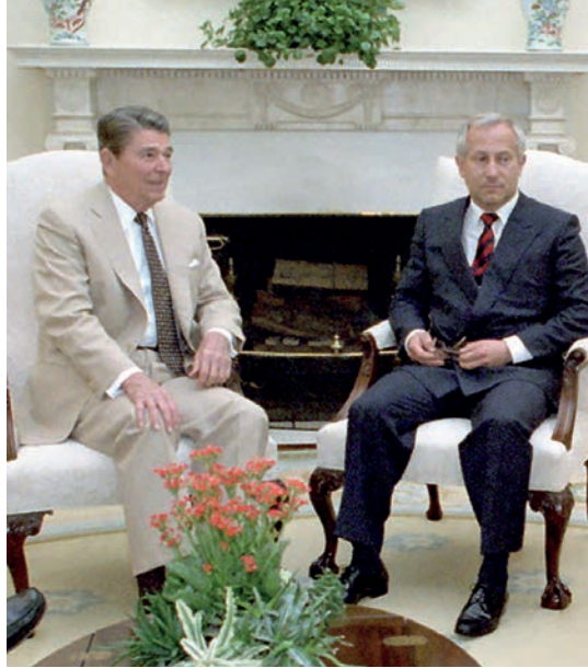
Oleg Gordievsky con el presidente estadounidense Ronald Reagan reunidos en 1987.

Estas preguntas guiarían la elaboración de la estimación especial de Inteligencia de mayo de 1984 (14). Elaborado por el Consejo Nacional de Inteligencia, este informe pretendía examinar los movimientos político-militares soviéticos desde el Able Archer para dilucidar qué pudo suceder. Desclasificado parcialmente en 2011, este trabajo concluyó que no existían evidencias suficientes para afirmar que Moscú hubiera entrado en pánico. El informe restó importancia al testimonio de Gordievsky (15) y minimizó la relevancia del RYaN al considerarlo una acción propagandística para incrementar las tensiones entre los aliados. Aseveraba que el desequilibrio estratégico a favor de Washington y el despliegue de los euromisiles inquietaban a Moscú porque percibía que la correlación de fuerzas estaba desapareciendo. También indicaba que las maniobras del Autumn Forge-83 habían sido más grandes y asertivas que en