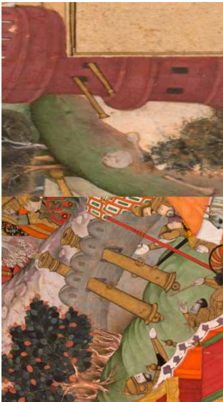
Figura 4. La fuerza de la artillería. El incendio de las mujeres rajputs en el fuerte Chitor, 1590-1595, en el Akbarnama