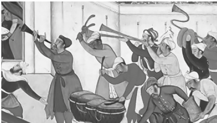
Figura 6. Las bandas militares tenían gran importancia, al igual que los estandartes. Gran regocijo por el nacimiento de del príncipe Salim, siglo XVI, Museo Victoria and Albert, Londres

Akbar dividió el ejército en 12 administraciones, siguiendo el mismo sistema de provincias. De este modo logró que sus oficiales rotaran por todas ellas. Con esto evitaba cualquier tipo de conspiración militar. El historiador indio, Agrawal, identifica un 35 % de desobediencia en los capitanes hindúes, por lo que esta última medida era realmente importante y urgente 47 . Para evitar ulteriores golpes de Estado, el monarca implantó un pago mensual para sus tropas. En muchos de los casos estos ingresos no se pudieron efectuar por lo que se recurrió a las asignaciones territoriales 48 .