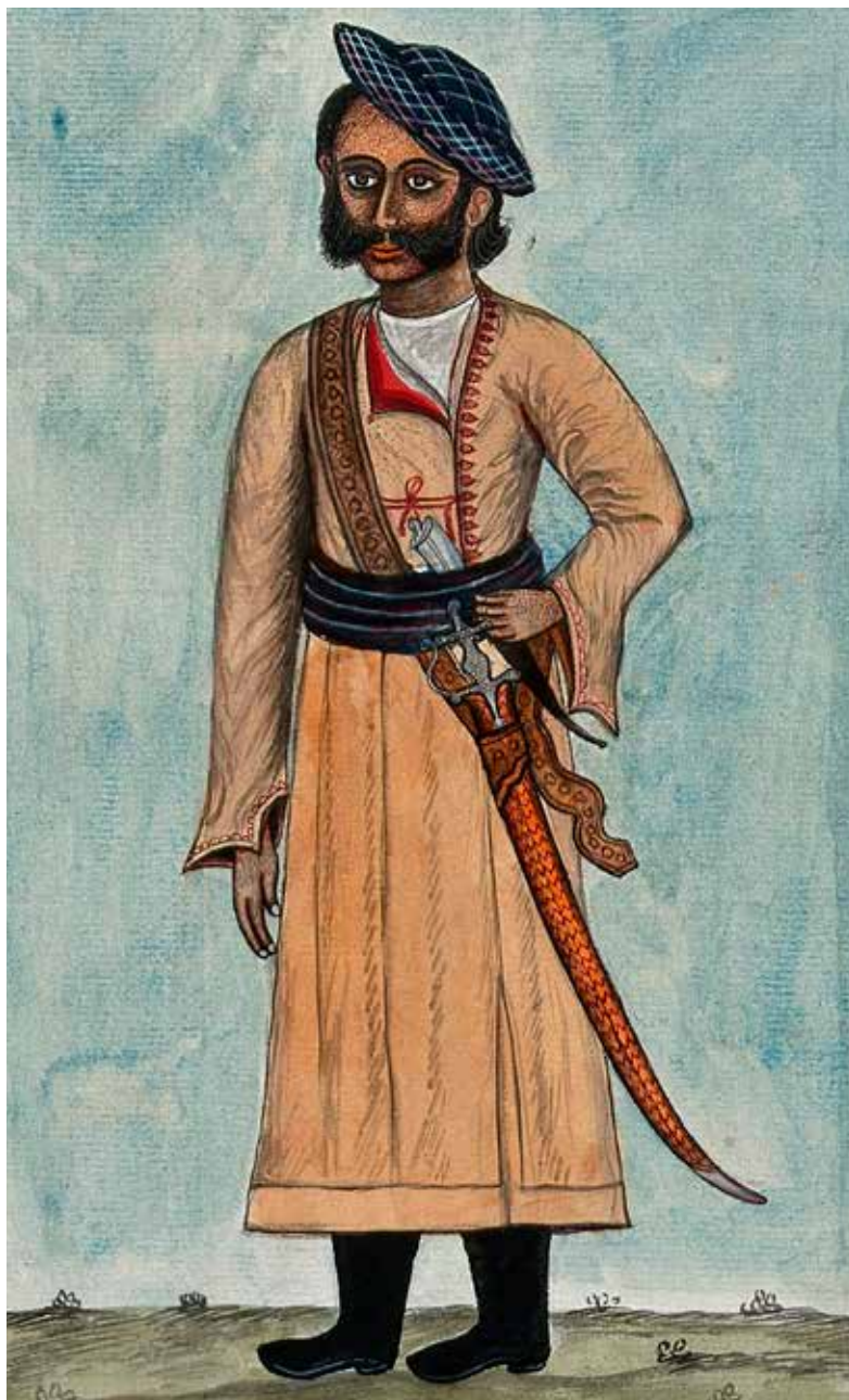
Figura 5. Daga mogol de tipo pesh-kabz en cintura masculina. Hombre mogol, a la moda inglesa ;1800-1850?