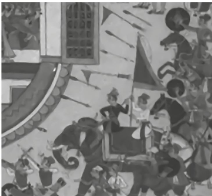
Figura 2. Uso de estandartes. Más adelante, observaremos la utilización de los elefantes como distinción y mecanismo de señas para las unidades 15

Baburnama La distribución del tesoro en Agra