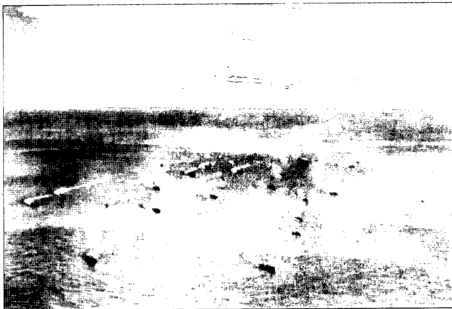
Un convoy, durante un cambio de rumbo urgente.

des del convoy, variaba en sentido inverso de dicho número, por ello se llegó a la conclusión de que debía darse a los convoyes grandes dimensiones. De aquí los gigantescos convoyes que se llegaron a formar en esta conflagración.