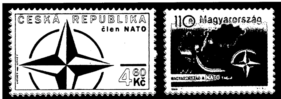
Reciente adhesión (República Checa y Hungría).

emblema de la Organización: una estrella de cuatro puntas, a modo de sencilla rosa de los vientos que marca los cuatro puntos cardinales.