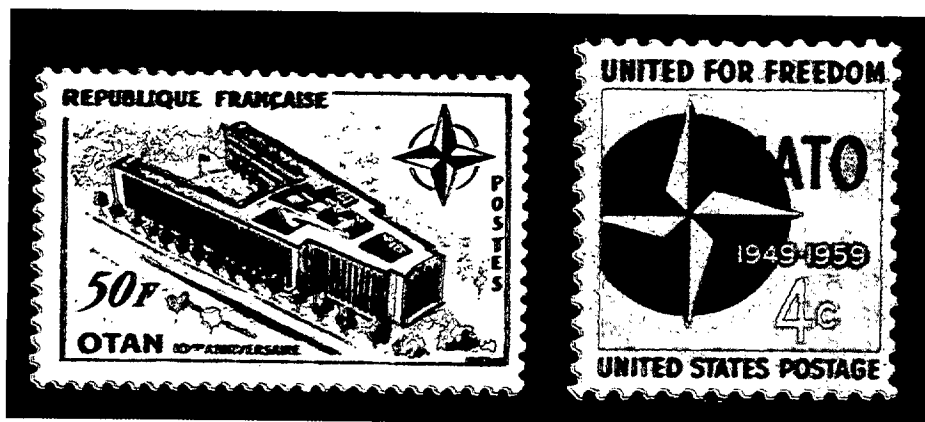
10.º Aniversario (Francia y Estados Unidos).

Durante las cuatro primeras décadas de su existencia, la OTAN actuó sobre todo como contrapeso del poderío militar de la URSS y de sus satélites del Este de Europa, en la conocida como «guerra fría». Pero fue con la caída del muro de Berlín en 1989, el desmembramiento de la URSS, y la desaparición del Pacto de Varsovia,