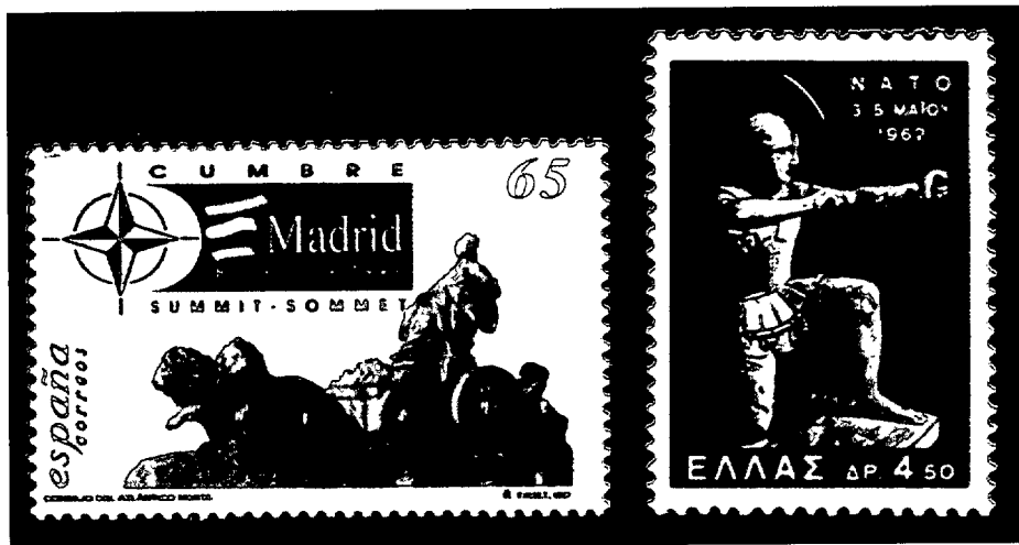
Acontecimientos destacables (España y Grecia).

Organización del Tratado del Atlántico Norte: la OTAN. En aquella histórica fecha nació una Alianza con un sistema colectivo de defensa, que en el pasado mes de abril de 1999, en la cumbre de Washington, apagaba el medio centenar de velas de la tarta de su 50 cumpleaños.