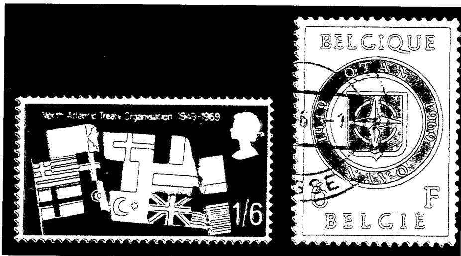
20.º Aniversario (Gran Bretaña y Bélgica).

cuando se produjo un profundo cambio en la situación mundial que llevó a un replanteamiento de la estrategia de la OTAN, que sin dejar de lado su objetivo de proporcionar seguridad a sus miembros, inició un acercamiento a otros países, y comenzó a intervenir en operaciones de control de crisis y de mantenimiento de la paz.