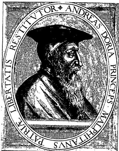
Andrea Doria, príncipe de Melfi, general de las armadas de Carlos V.

niéndose á la guarnición, y asestaron los cañones contra las huestes de Barbarroja desbandada», huyendo éste, «seguido de los turcos», acompañándole también Sinán y Cachidiablo , quien al poco tiempo murió a consecuencia de las heridas recibidas.