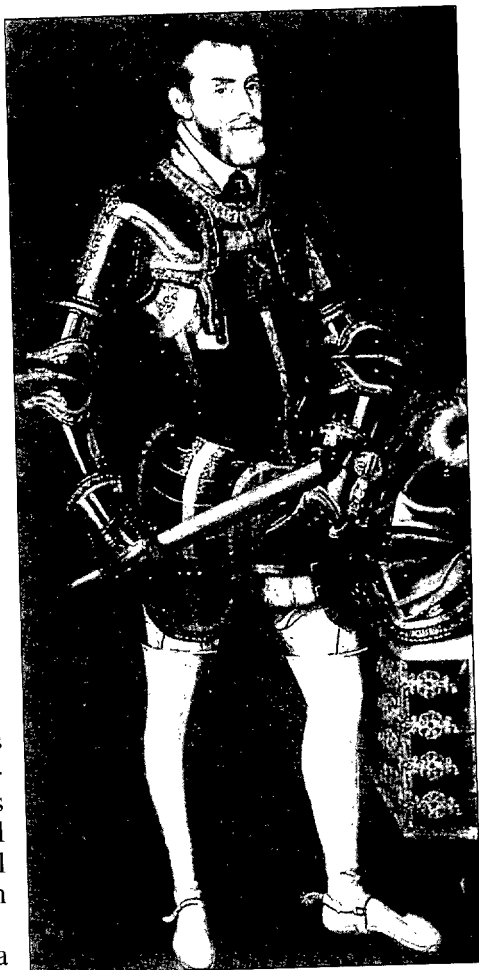
Carlos I de España y V de Alemania. (Pantoja de la Cruz. Copia de un original de Tiziano. Monasterio de El Escorial).

Pasó el César Carlos una revista solemne a las tropas, y habiendo hecho una devota visita a la Virgen de Montserrat y «comulgado en Santa María del Mar», embarcó en la galera imperial, el día 30 de mayo de 1535, publicando un bando «con órdenes para el viaje», entre las cuales una de ellas ordenaba que «hubiera treguas entre todas las personas enemistadas por el término de la jornada», quedando unos y otros bajo el amparo real; en otras «prohibía en absoluto el embarco de mujeres» (3).