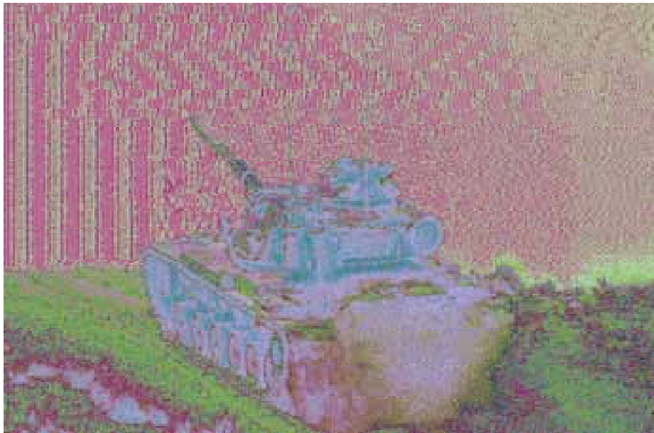
M-60 en Almería.

Desde entonces, la Compañía deja de ser una unidad de apoyo para constituir una parte intrínseca del recién inaugurado BDMz-III, que está constituido