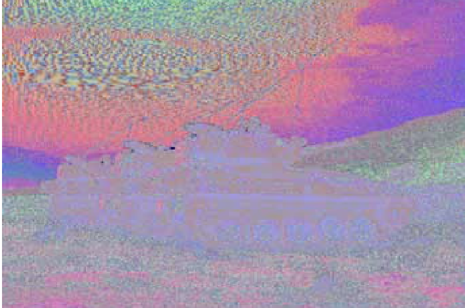
Scorpion en Almería.

carro: 63 disparos 105 mm; blindaje homogéneo y láminas paralelas; estabilización de torre y cañón mediante dos giróscopos; ocultación mediante sistema TESS; capacidad de visión térmica (TTS, Tank Thermal Sight ).