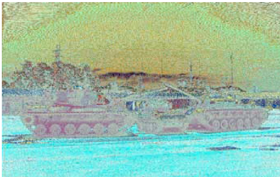
M-48, M-60 y Scorpion.

Con el transcurrir de los años, los «carros de combate M-48 » necesitaron de un merecido proceso de modernización, que fue desarrollado entre los años 1976-77 y que consistió fundamentalmente en la conversión del antiguo motor de gasolina en uno diésel, y en una serie de modernizaciones de distintos sistemas del carro.