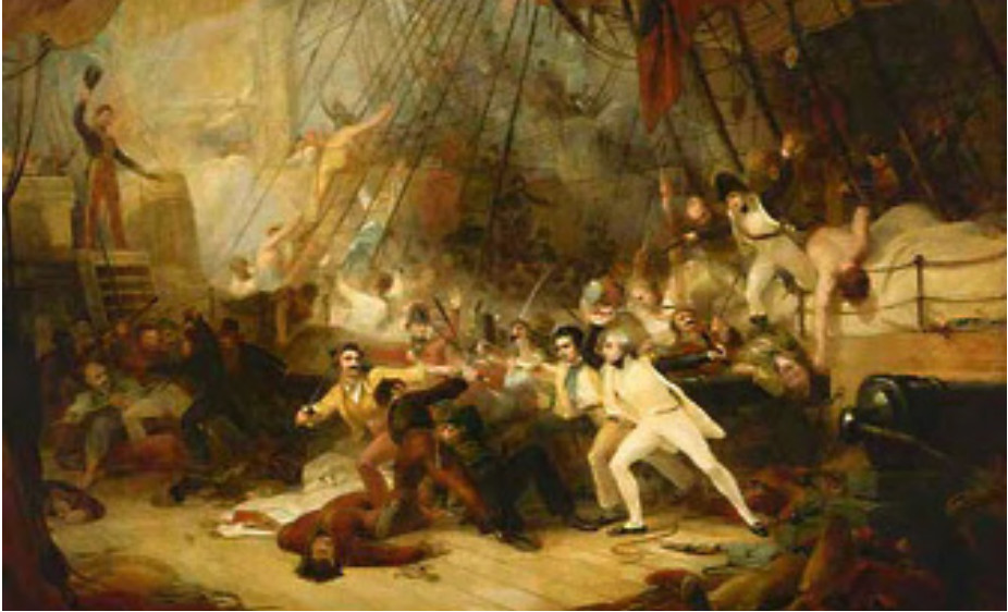
Ilustración 1.—Nelson en el momento de abordar el navío San José . Greenwich Hospital Collection. (National Maritime Museum. Londres).