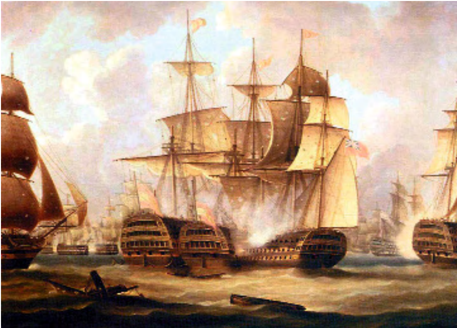
Detalle del cuadro de Thomas Buttersworth The battle of cape St. Vincent . El San Nicolás y el San José . (Colección privada).

San Vicente, donde es hecho prisionero. De esta manera, a los 47 años, finaliza su vida en el mar al servicio de la Real Armada. Navegó catorce años y tres meses, teniendo bajo sus órdenes un total de dos corbetas, tres fragatas y cuatro navíos.