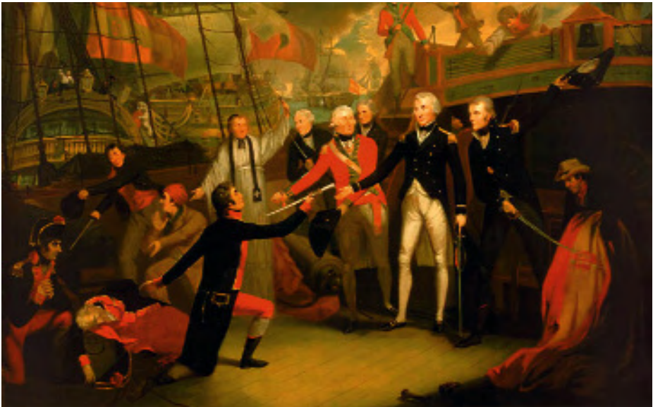
Ilustración 2.—Rendición del navío español San José en la batalla del cabo San Vicente. Obra de Daniel Orme de 1799. (National Maritime Museum. Londres).