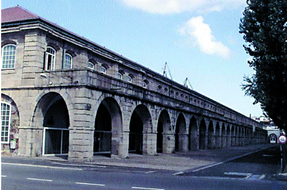
Antigo Gran Tinglado de Maestranza (Sala de Proyectos de Navantia).

y se produjo la pérdida parcial de la antigua muralla (una de las garitas fue trasladada a Puerto Chico).