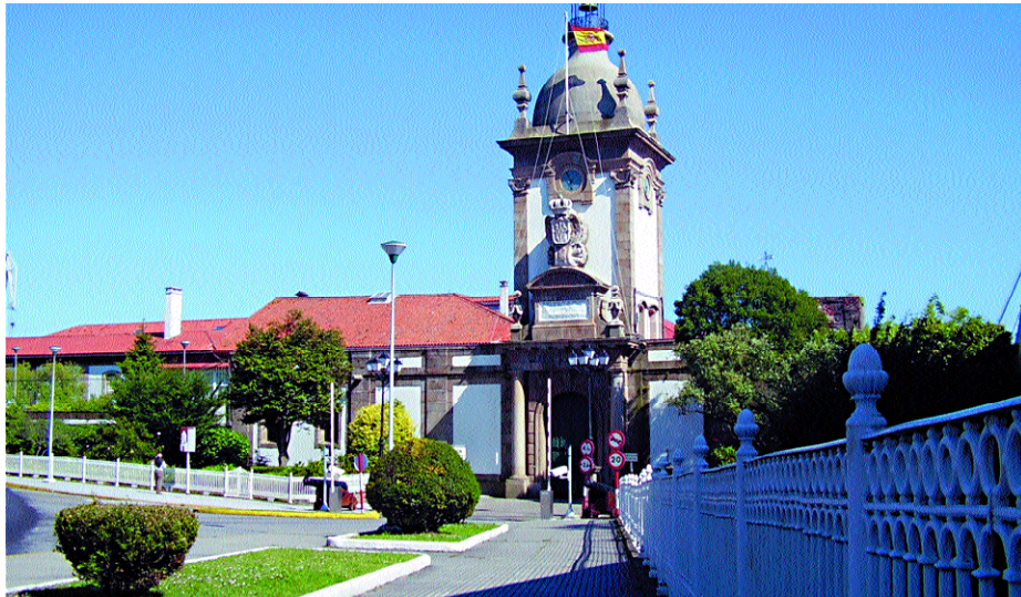
Puerta del Parque y foso defensivo del Arsenal.