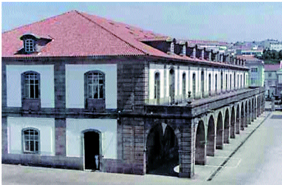
Antigua Teneduría (oficinas Comandancia General Arsenal).