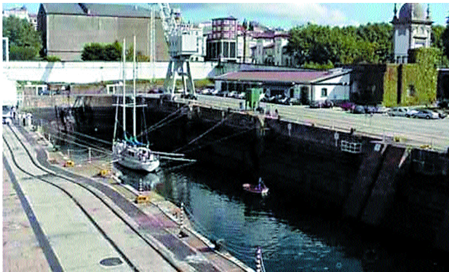
Dique de carenar San Julián.