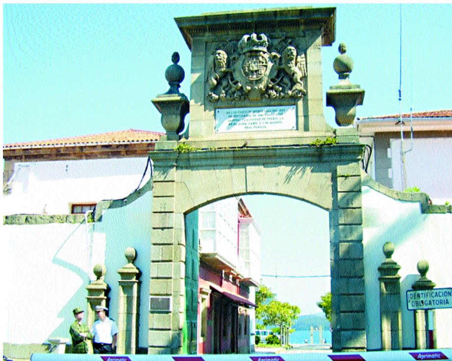
Puerta del Parque.