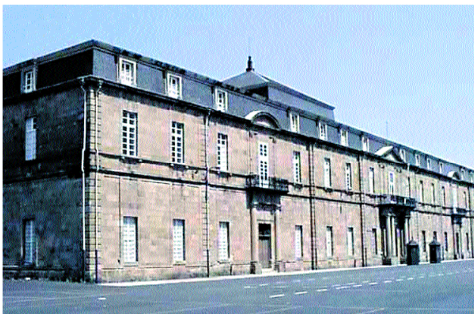
Antigua Sala de Armas y paños porticados.