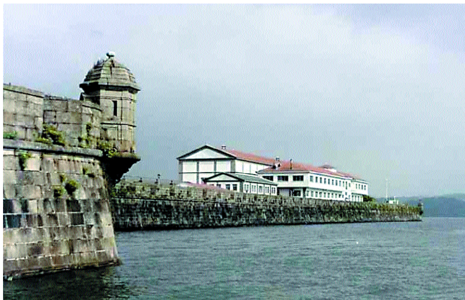
Dique de abrigo y batería de La Cortina.