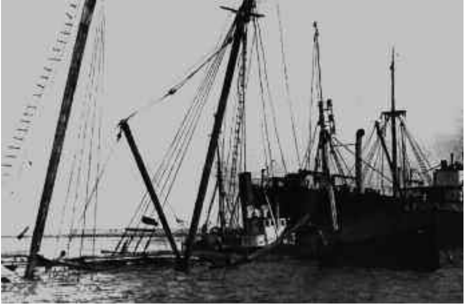
Treska en Parnu, agosto de 1941.