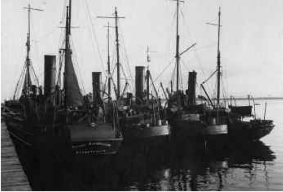
Felix Dzerzhinsky y Saida.

como RT-40 Saida . Después, en 1952, fue empleado como buque de carga. Se hundiría en 1962 al colisionar con el vapor griego Glifada (clase Liberti ) cerca del cabo Mashukov, si bien su tripulación pudo ser rescatada del agua.