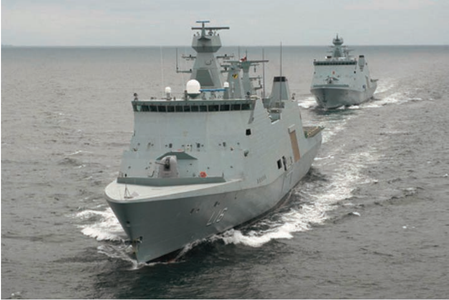
Los dos buques de apoyo de la clase Absalon , construidos en el astillero Odense Steel para la Real Marina danesa.