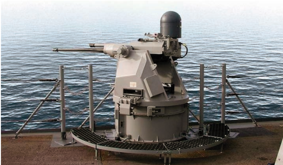
Mk 38 mod. 2 de BAE Systems.

La alta tasa de disparo (120 cartuchos por minuto) de las armas Super Rapid de 76/62 mm de Oto Melara (BAE Systems posee la licencia de construcción de estas armas como Mk 75 y se encuentran montadas en las fragatas estadounidenses de la clase Perry y en los patrulleros del Servicio de Guardacostas estadounidense) y su 3AP (Munición Multifunción Programable) las hacen efectivas para la defensa de corta y