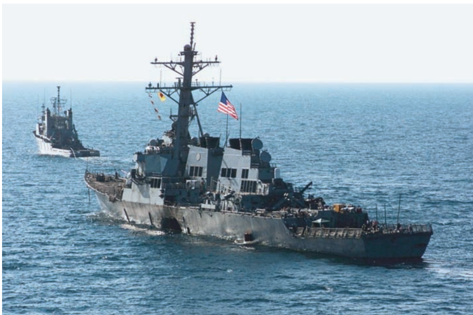
Daños provocados al USS Cole .

El incidente del USS Cole nos ha mostrado palpablemente el tipo de daños que un bote pequeño puede provocar a un buque de combate mayor y que