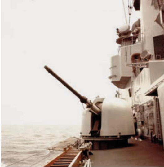
Oto Melara 76/62 Super Rapid Gun Mount.

vo de unas cinco millas, en vez de las 13 millas de los tradicionales disparos de cinco pulgadas. La US Navy también está llevando a cabo un programa de «mejora del producto y reducción de los costes» en las espoletas multifunción para los cartuchos de cinco pulgadas, tendente a reducir el efecto clutter del mar.