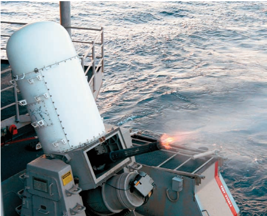
Mk 15 Phalanx Close-In Weapons Systems (CIWS) de Raytheon.

En reconocimiento al incremento en la preocupación respecto a ataques provenientes de embarcaciones de menor tamaño, uno de los armamentos navales antimisiles más usados, el MK 15 Phalanx Close-In Weapons Systems (CIWS) de Raytheon, ha sido adaptado para mejorar su efectividad contra esas amenazas. La compacta unidad CIWS, con su radar dual de búsqueda y