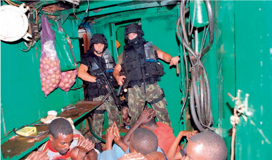
Equipo de abordaje del Corte Real a bordo del buque pirata.

largo de la costa de Somalia, contribuyendo a salvaguardar la seguridad en aquella región del globo. Este galardón, creado por la IMO en el año 2006 con el objetivo de reconocer actos de «excepcional bravura» en acciones de salvamento de vidas y en la prevención de daños contra el medio ambiente marino, fue entregado por el secretario general de la IMO al comandante del buque, que estaba acompañado por el embajador portugués en Londres. La entrega de este premio a la fragata portuguesa vino no sólo a reconocer la valía de la dotación en el desempeño de la misión en la operación ALLIED PROTECTOR en el Cuerno de África, sino también a premiar y dignificar el esfuerzo de la Marina y del Estado portugués en la lucha contra la piratería.