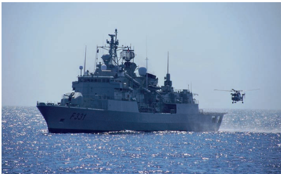
Fragata Alvares de Cabral , que tomó parte en la Operación OCEAN SHIELD.

La operación OCEAN SHIELD viene a dar continuidad a las operaciones ALLIED PROTECTOR —que transcurrió del 24 de marzo al 16 de agosto del