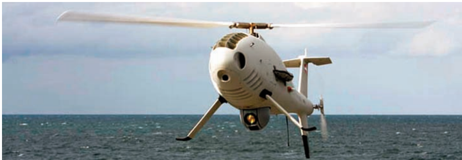
CAMCOPTER S 100 ( http://www.schiebel.net/ ).

FAS, nos encontramos en pleno proceso de transformación de concepto a capacidad militar, aunque con diferente grado de implantación dependiendo de la institución de la que estemos hablando.