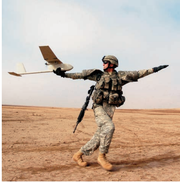
Mini UAV Raven RQ 11B.

Además del anterior proyecto, en los últimos años se ha asistido a la presentación y demostración de otros UAV como el Camcopter S 100 , un VTOL de la compañía austriaca Schiebel, de unos 3,5 m de envergadura y 120 kg de peso, autonomía, radio de acción y techo medios, que puede despegar y