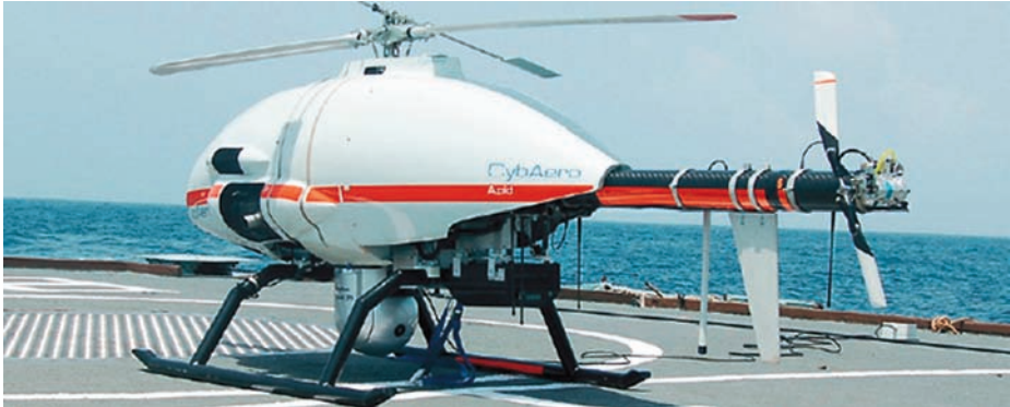
APID 60 ( http://www.cybaero.se/ ).

tirá en una extensión del resto de sensores del buque. El sistema de misión incluye un sensor optrónico de vigilancia, IFF, AIS y Data Link, pudiendo incorporar en un futuro un radar de apertura sintética, así como medios de guerra electrónica y sensores de detección de amenazas nucleares, bacteriológicas, químicas y radiactivas (NBQR).