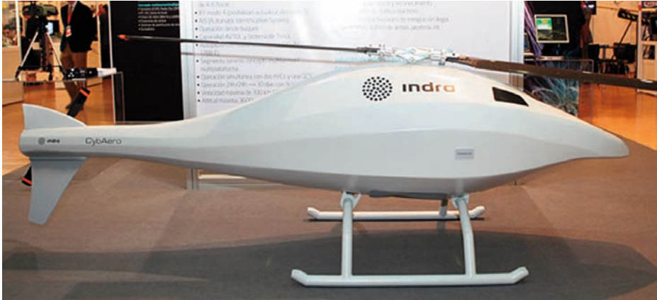
Prototipo UAV Pelicano ( http://www.indracompany.com/sectores/seguridad-y-defensa/nuestra-oferta/seguridad-y-defensa/aviones-no-tripulados ).

tomar en la cubierta de un buque y realizar misiones programadas en modo de vuelo autónomo, o dirigido manualmente por un operador.