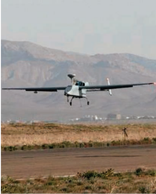
UAV-PASI Searcher MK II J en Afganistán.

de altitud y tiene una autonomía de hasta 14 horas, pudiendo llegar su alcance hasta los 250 kilómetros. Cuenta con capacidad de despegue y aterrizaje horizontal autónomos ( Automatic Take off and Landing-ATOL ).