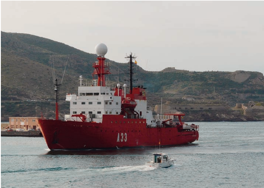
BIO Hespérides .

La expedición Malaspina 2010 recibe su nombre como homenaje al ilustre marino Alejandro Malaspina. Será la primera vez que España lidera, en estrecha colaboración ente el CSIC y la Armada, una gran expedición en la que participarán, entre otros, la NASA, la Agencia Espacial Europea y el Departamento de Energía Estadounidense.