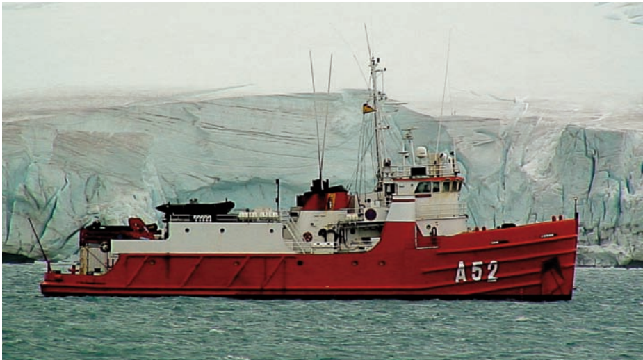
BIO Las Palmas .

Ambos buques han contribuido a mantener la base Juan Carlos I, siendo importante destacar que en la actualidad se han cumplido más de veinte años de permanencia continuada de España en la Antártida. En la campaña 2009/2010, el Hespérides tuvo por misión observar cómo afecta el cambio climático a los océanos, con objeto de conocer los efectos de la contaminación, así como la radiación ultravioleta producida por el agujero en la capa de ozono que protege la Tierra. En este proyecto participaron científicos españoles del CSIC. El resultado servirá para mejorar el conocimiento de los problemas que afectan a la salud global de los océanos.