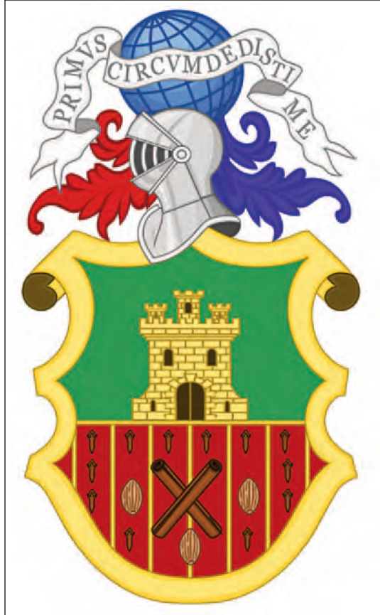
Escudo de armas concedido por Carlos I a Juan Sebastián Elcano tras completar la primera vuelta al mundo

servicio del rey de Castilla; basta recordar las palabras que Luís de Camões le dedica en su obra Os Lusíadas : «Pero es justo contemplar a Poniente el logro de un lusitano que, considerándose humillado por su Rey, tomó un camino nunca antes imaginado... Magallanes, un verdadero portugués en actos, aunque no en lealtad». En la actualidad su figura ha sido enteramente rehabilitada como gran navegante y descubridor y algunos le consideran como el único protagonista de la gran gesta; ya que ningunean a Juan Sebastián Elcano haciéndole aparecer como un personaje secundario que, a la muerte de Magallanes, simplemente eligió la ruta portuguesa para su regreso a España. Es misión de todos defender la gran gesta de Juan Sebastián de Elcano sin entrar en estériles y pueriles polémicas, sabiendo que formó parte de la expedición española iniciada por Magallanes auspiciada y patrocinada por el emperador Carlos V. Hay que tener siempre presente, y decirlo con orgullo, que quien puede lucir en su escudo Primus circumdedisti me es un marino español, un vasco nacido en Guetaria.