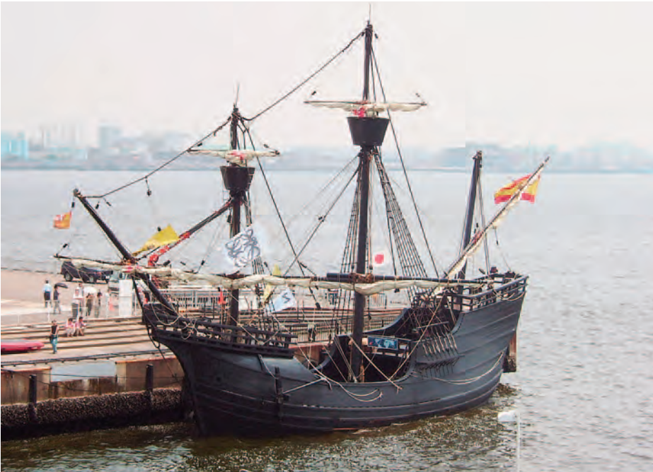
Réplica de la nao Victoria .

La gesta iniciada por Magallanes y concluida por Elcano marca un punto de inflexión sobre el conocimiento de las dimensiones y configuración