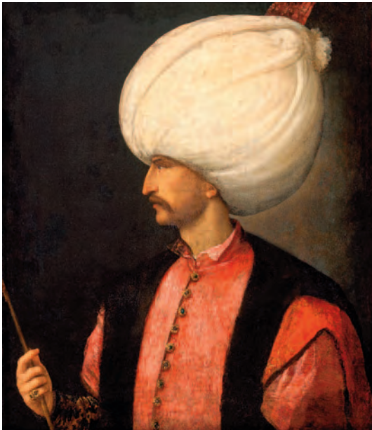
Retrato de Solimán hacia 1530, hecho por Tiziano. (Foto: www.wikipedia.org )

No es necesario convertir a Magallanes en español de nacimiento. En el ceremonial de despedida de la expedición, el día 10 de agosto de 1519, se le entrega a Magallanes el Estandarte Real y es investido capitán general y caballero de la Orden de Santiago con el juramento que realiza de fidelidad a Carlos I. En su testamento, realizado en Sevilla el mes de agosto de 1519, en el que impone a sus legatarios: «la indispensable condición de apellidarse Magallanes, usar las armas o blasón de los Magallanes, y residir y casarse en