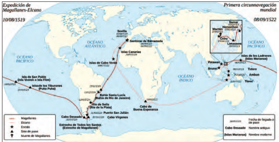
Mapa del primer viaje de circunnavegación.

pero en esta ocasión impuso su criterio. Con este convencimiento inició la nao Victoria una larga travesía sin hacer escalas, doblando Buena Esperanza llegando a Cabo Verde, medio desvencijada y con unos cuantos años de vida. Elcano deja constancia de estos hechos en la carta que envía a Carlos I a su llegada a Sanlúcar: «Queriéndonos partir de las islas de Maluco a la vuelta de España, [...] y pasado el tiempo en que las naos van para Java y Malaca, determinamos morir y, con grande honra a servicio de tu Alta «Magestad», por hacerla sabedora del dicho descubrimiento, con una sola nao partir». Elcano emprende el regreso sabedor que va a luchar contra un «monzón» del oeste, vientos dominantes en la zona en invierno con la idea de comunicar al emperador el resultado de la expedición.