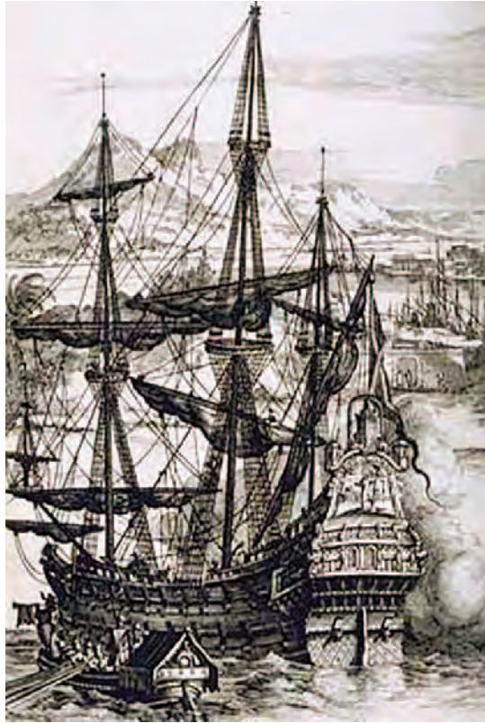
Galeón español.

Durante el siglo XVI Cádiz mantuvo un tira y afloja con la Corona, pues desde Sevilla no se querían permitir excesivas licencias y privilegios, con la finalidad de evitar fraudes y desviaciones en los beneficios. De este modo, surgió cierta rivalidad entre las autoridades mercantiles de Sevilla y los mercaderes establecidos en Cádiz, varios de ellos extranjeros. Además, empezaba a asomar un problema logístico debido a la entrada por Sanlúcar de Barrameda para llegar a Sevilla, por lo que la citada cédula autorizaba a los mercaderes de determinados barcos que iban a