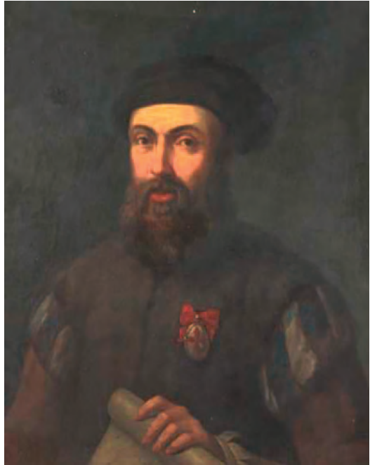
Hernando de Magallanes (1480-1521).

Sevilla no ejerció con exclusividad su condición de cabecera y terminal de las flotas de Indias, pues muy pronto se instalaron en Cádiz y en Sanlúcar de Barrameda delegaciones de la Casa de la Contratación, tanto para controlar la partida y retorno de las naves autorizadas a utilizar los puertos de la bahía de Cádiz como para supervisar la carga en la barra del Guadalquivir; de hecho, a partir de entonces las expediciones no fueron portuenses, gaditanas o sevillanas puras y, en el año 1717, la Casa de la Contratación se trasladaría definitivamente al puerto gaditano.