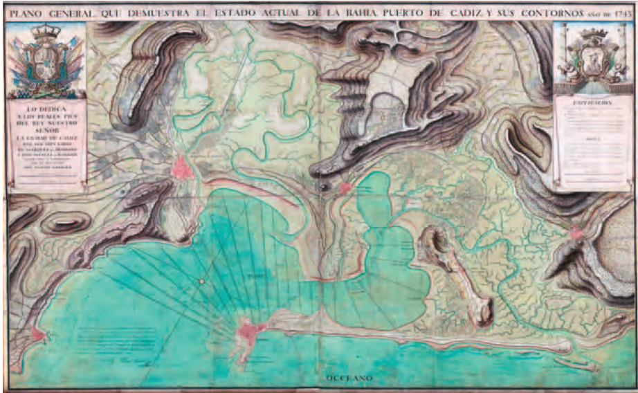
Plano general de la bahía y puerto de Cádiz. (Museo Naval de Madrid)

propia Sevilla como en Cádiz, donde se incrementarían las asociaciones mercantiles durante el siglo siguiente. La presión por rebajar los impuestos en Cádiz, sumada a las dificultades de navegación por el Guadalquivir, provocó una guerra fiscal entre los núcleos mercantiles de ambos puertos andaluces. Con el tiempo, Cádiz sería el puerto principal de arribadas de las flotas, tanto por las demandas de los grupos mercantiles como por la dificultad de remontar la denominada barra de Sanlúcar, pues desde el principio se perdieron barcos con cargamentos de plata que tuvieron que ser desalojados desde antepuertos fluviales al regularse los registros en Sevilla.