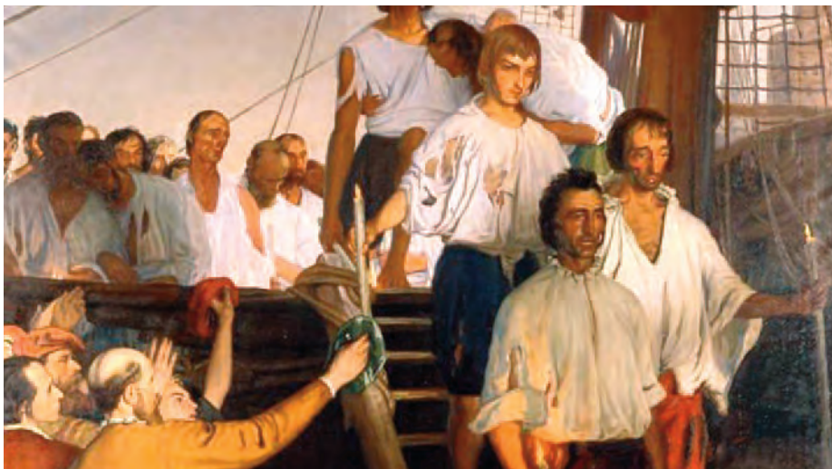
Detalle del cuadro El regreso a Sevilla de Juan Sebastián Elcano , de Elías Salaverría, 1919. (Museo Naval de Madrid)