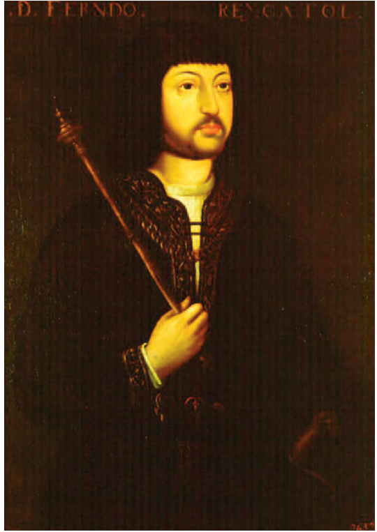
Retrato de Fernando I de Aragón.

En la batalla de Toro, que tuvo lugar el 1 de marzo de 1476, en la que se enfrentaron los ejércitos de Alfonso V de Portugal y de Fernando el Católico, inició el ataque la vanguardia portuguesa, que fue detenida por las tropas del cardenal Mendoza, y el duque de Alba aprovechó la ocasión para flanquear con su ejército el ala derecha de los portugueses. Aunque las pérdidas fueron grandes en los dos bandos, al final el triunfo de los castellanos sirvió para terminar con las divisiones de la nobleza de Castilla. Medina Sidonia y los regidores de la ciudad de Sevilla presentaron juramento a los Reyes Católicos, y algo después, también el marqués de Cádiz, Rodrigo Ponce de León, que gracias a