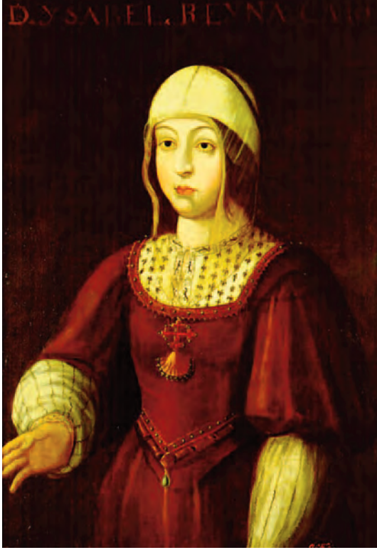
Retrato de Isabel I de Castilla. (Museo Naval de Madrid)

además de productos como el atún y el aceite propios de la misma Andalucía y su costa, otros como dátiles o goma arábiga procedentes del continente africano. Cádiz, con El Puerto de Santa María, era desde tiempos remotos el bastión más importante del comercio genovés con el norte de Europa.