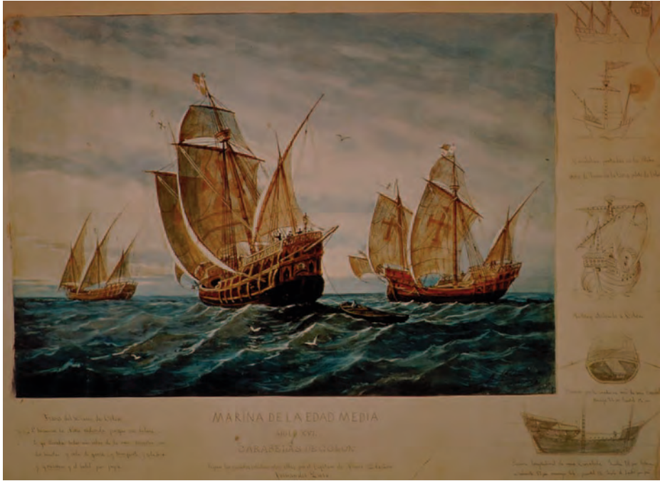
Carabelas en su camino hacia el Descubrimiento de América. (Museo Naval de Madrid)

Palos de Moguer como de Sanlúcar de Barrameda, Sevilla, Cádiz, El Puerto de Santa María, Rota, etc., unidos en torno a un proyecto común, del que se hizo responsable la Corona de Castilla. En 1483, erigió en el fondo de la gran bahía gaditana una villa real: Puerto Real, que contaba con un buen fondeadero.