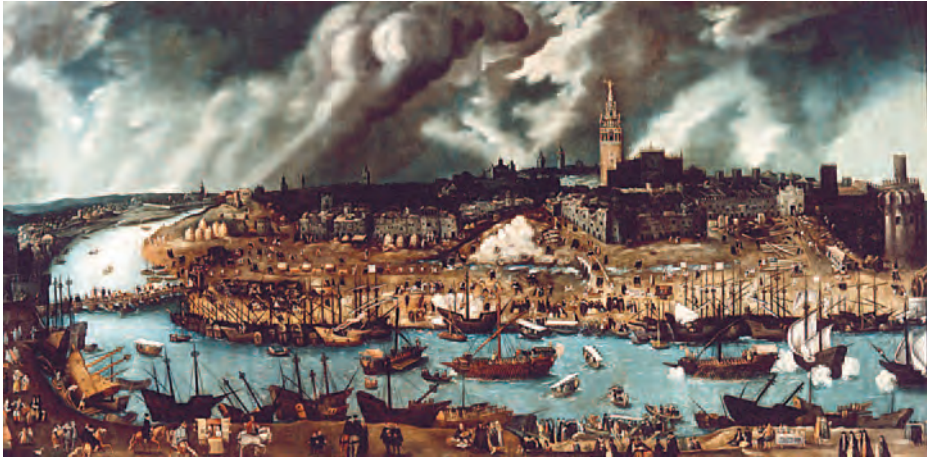
La Sevilla del siglo XVI.

golfo de Cádiz — desde el cabo San Vicente hasta el Estrecho, con excepción del Algarve que pertenecía a Portugal — había muchos puertos desde la desembocadura del Guadiana hasta Gibraltar que no tenían las dificultades de navegabilidad del Guadalquivir y la limitada infraestructura de muelles pues, a excepción de las Atarazanas construidas en el siglo XIII, hasta principios del siglo XV no se contó con un desembarcadero en condiciones, que en principio se utilizó para descargar las piedras que iban a sostener la catedral. Construido junto a la Torre del Oro, luego se denominó Muelle de la Aduana debido a sus nuevas funciones.