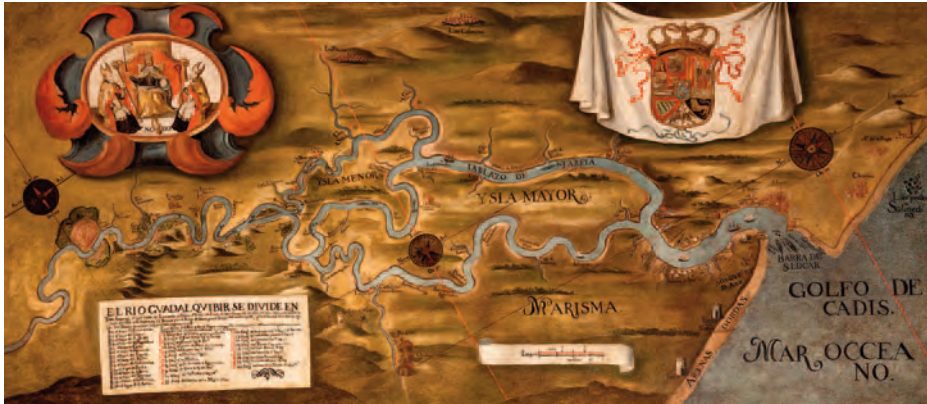
El río Guadalquivir en el siglo XVI.

Cádiz, con su gran bahía, podría perfectamente haber sido puerto de Indias; de hecho lo sería dos siglos después, dadas las características de los buques, de dimensiones cada vez mayores que hacían difícil remontar el Guadalquivir. Pero en 1503 era una ciudad pequeña, casi aislada de la Península y, a pesar de sus fortalezas, estaba expuesta a los ataques por mar. Además, los Reyes Católicos habían conseguido controlar los conflictos feudales, aunque fue preciso contar con los nobles, algunos muy expertos en la formación de expediciones, como ocurría con la Casa de Medina Sidonia, por lo que desde el primer momento no se pudo prescindir de Cádiz que, con El Puerto de Santa María, quedó integrado en el entramado mediante delegaciones de la Casa de la Contratación, y llegaría un momento, en 1717, en que se convertiría en el puerto de cabecera.