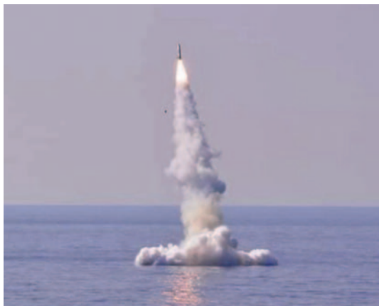
Lanzamiento de un misil Kalibr Club-S desde un submarino clase Kilo 636 argelino, septiembre de 2019.

aproximación a las áreas protegidas, unos costes que resulten inasumibles. Si consideramos la postura de Irán ante una intervención de los Estados Unidos hostil a sus intereses en el área del golfo Pérsico, las líneas de su respuesta son muy parecidas, aunque moduladas por su disponibilidad mucho más discreta de recursos y capacidades. El caso es que la proliferación de misiles de medio y largo alcance antibuque, como por ejemplo los Club, versión para la exportación del Kalibr ruso en el mercado internacio-