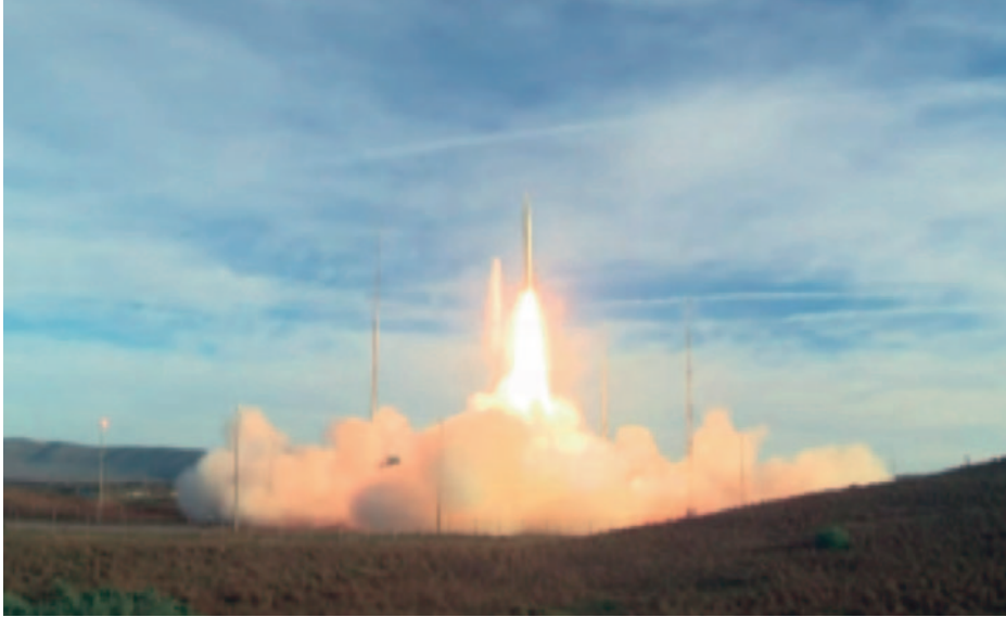
Lanzamiento de prueba de un misil IRBM desde la base de Vandenberg, California, el 12 de diciembre de 2019.

desplegar en su territorio, y en Japón el gobernador de Okinawa rápidamente se opuso a la instalación de misiles americanos en su isla (11), situación que inicialmente y en caso de una contingencia dejaría a los submarinos de la Marina estadounidense y de sus aliados como el principal y casi único medio naval con el que operar en aguas interiores a las cadenas de islas.