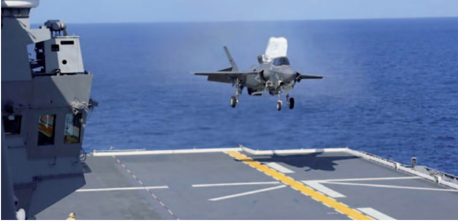
F-35B en ensayos a bordo del destructor portahelicópteros Izumo de la Fuerza de Autodefensa Marítima de Japón, 3 de octubre de 2021.

nación con las fuerzas submarinas de naciones aliadas, operaría dentro y fuera de las cadenas de islas para batir blancos navales y terrestres designados por los sistemas de observación. Una situación cuya primera consecuencia es la necesidad de «apagar» los medios de observación del contrario y que podría llevar a campañas antisatélite al inicio mismo de las eventuales hostilidades. Otra derivación es la necesidad de las fuerzas de superficie de operar siempre bajo la cobertura de una potente defensa antimisil, ya sea basada en tierra o propia de la fuerza naval, y en este último caso no solo son necesarios excelentes radares para la detección de misiles, sino también disponer de un número muy elevado de misiles listos para su empleo frente ataques por saturación. En todo caso, la disponibilidad por los dos eventuales bandos contendientes de un gran número de submarinos hace evidente la necesidad de contar con capacidad antisubmarina de largo alcance.