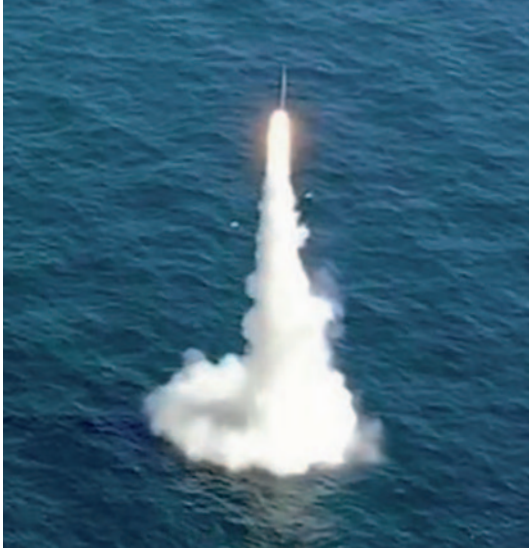
Lanzamiento del misil SLBM Hyunmoo 4-4 desde un submarino surcoreano clase Dosan Ahn Chang-ho , septiembre de 2021.

largo de la historia, esencialmente en un sentido determinante general, el incremento en la distancia de su empleo: los combates en la época de la vela se decidían con el abordaje entre los buques enemigos y más tarde con un fuego artillero masivo con una separación de escasos metros; después, con el incremento del alcance de los cañones, los buques se batían a distancias cada vez mayores —en el combate entre el Bismarck y el Hood el fuego se inició a 25.000 yardas (3)—. Con el reinado del portaviones a partir de 1940 ya no fue necesario que las fuerzas navales combatiesen dentro del alcance visual; la batalla del mar del Coral fue la primera en la que los