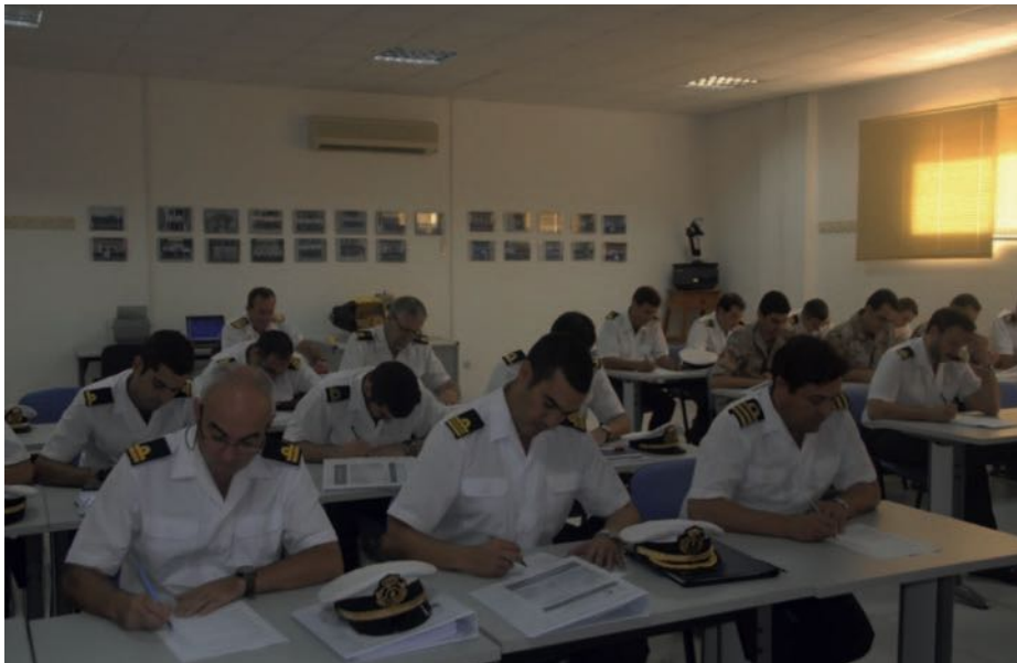
Alumnos del Curso Operaciones MCM, septiembre 2013.

A partir de este momento, la Sección Departamental, en coordinación directa (3) con la Jefatura de Órdenes de MCM, fija las fechas de los diferentes cursos en los períodos de baja actividad de los buques y de acuerdo a las necesidades de las unidades.