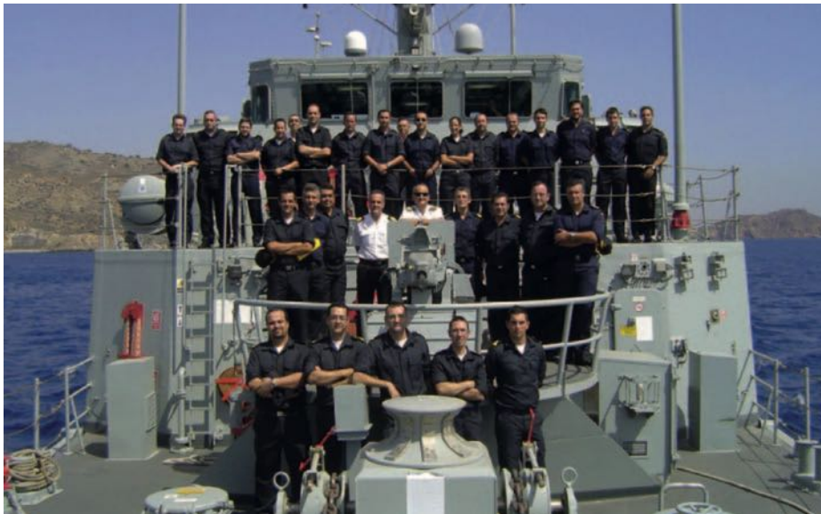
Prácticas en la mar a bordo del cazaminas Turia . Curso de Operaciones MCM, 2009.