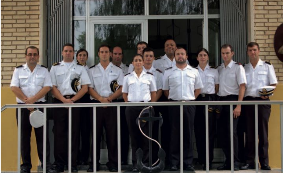
Clausura del Curso Sistema Minesniper 2010. (Foto: archivo Sección Departamental de MCM-Escuela de Especialidades «Antonio de Escaño» de Cartagena).

En este sentido, las nuevas tecnologías en el ámbito submarino, como los AUV, que nos llevarán a la necesaria transición hacia medios MCM no tripulados en un futuro cercano, requieren una nueva y particular orientación de la formación en NMW; por ello, se ha ampliado el plan de estudios del citado curso para adaptar la formación del personal en esta área específica a las necesidades de la situación actual, tanto en lo que se refiere a la normativa sobre la enseñanza como a los nuevos sistemas de MCM, que comienzan a ser una realidad y demandan una orientación específica.