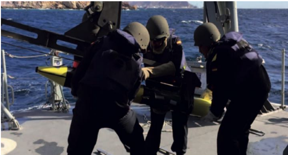
Prácticas en la mar del Curso Equipos ID y Contraminado ( Minesniper ).

Los objetivos en materia de NMW consisten en ir creando «aulas» (7) para cada uno de los diferentes cursos que se vayan impartiendo. Para ello se deben ir preparando los siguientes contenidos: