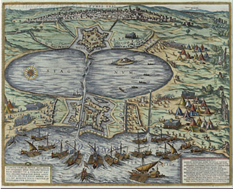
La flota otomana atacando La Goleta (Túnez), 1574. Braun and Hogenberg. (Fuente: www.wikipedia.org )

Con todo, aunque es cierto que Lepanto frenó el avance imparable de los otomanos que parecían imbatibles en la mar sobre Occidente, no quebró el espinazo infiel y los cristianos no sacaron partido del éxito por varios motivos, entre ellos lo avanzado de la estación con la amenaza de temporales, los débiles lazos de cohesión entre los participantes —con intereses muy diversos— y también por la desconfianza entre dos de los principales coaligados: España y Venecia. A partir de aquí, la contienda turco-cristiana se aplacó, si bien habrían de protagonizar un nuevo enfrentamiento en 1574, porque para entonces, el sultán turco ya había logrado reconstruir su Armada y poner a flote una fuerza comparable, en número y calidad de barcos, a la que había perdido en Lepanto. En efecto, los otomanos tomaron Túnez, conquistada por Carlos V en 1535, que marcó el éxito del Imperio otomano sobre el hispánico y decidió que el norte de África estaría bajo dominio musulmán en lugar de cristiano, poniendo fin a la conquista española en el Magreb iniciada en tiempos de los Reyes Católicos.