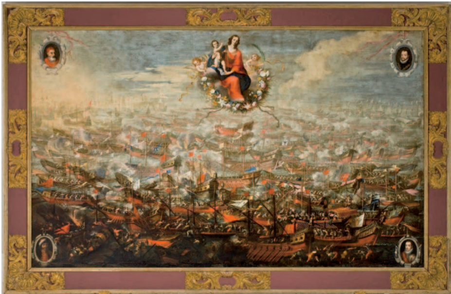
Batalla de Lepanto, por Juan de Toledo y Mateo Gilarte. Actualmente en la iglesia de Santo Domingo (Murcia).

Pero junto con estas célebres batallas, quizá lo más significativo fue el conflicto periódico, concebido sobre numerosas refriegas, resueltas incursiones y razzias tierra adentro. La piratería berberisca amparada desde Estambul