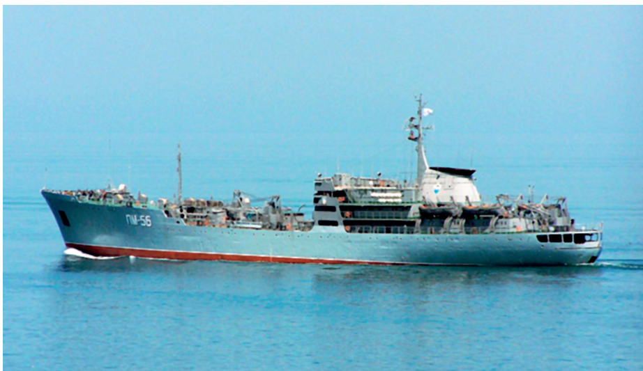
Buque taller PM-56 de la Flota rusa del Mar Negro.