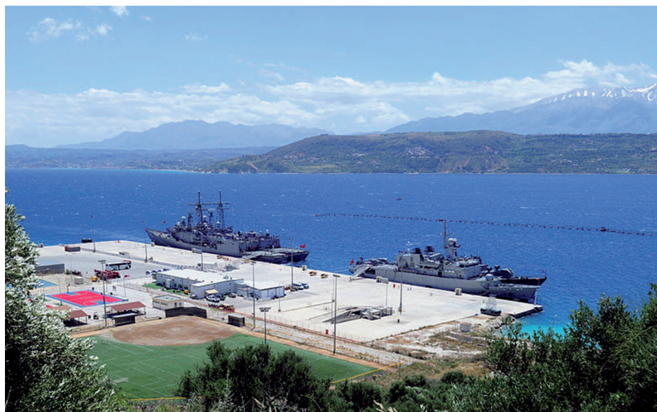
Vista de la bahía de Suda durante el ejercicio PHOENIX EXPRESS 2012.

Tras su entrada en la Organización del Tratado del Atlántico Norte en 1952, Grecia firmó un acuerdo, el 12 de octubre de 1953, para el establecimiento de bases militares estadounidenses en su territorio. La relación cercana con Estados Unidos fue un legado de la Guerra Civil griega, en la que su apoyo fue imprescindible para hacer frente al bando comunista apoyado por Albania, Bulgaria y Yugoslavia (Powaski, 2000:95-96). Las relaciones con la