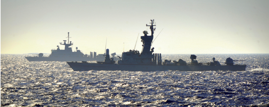
Corbeta israelí clase Sa'ar 4.5 y patrullera griega clase Roussen .

embargo, Rusia y Siria han firmado nuevos contratos de venta de armamentos (Grove, 2013). En la primera mitad de 2013, Siria recibió una versión avanzada del misil antibuque ruso Yajont (Gordon y Schmitt, 2013). Ese aumento de capacidades de Siria no pasó desapercibido y los depósitos militares que los albergaban cerca del puerto de Latakia fueron atacados el 5 de julio por la Fuerza Aérea o la Marina israelíes (Gordon, 2013). Otros contratos prevén la venta de 12 cazabombarderos MiG-29M2 y 36 entrenadores avanzados Yak-130 (Defense Industry Daily, 2014), aunque la exigencia rusa de pagos por adelantado refleja una perspectiva más cauta de Moscú sobre la supervivencia del régimen de Assad.