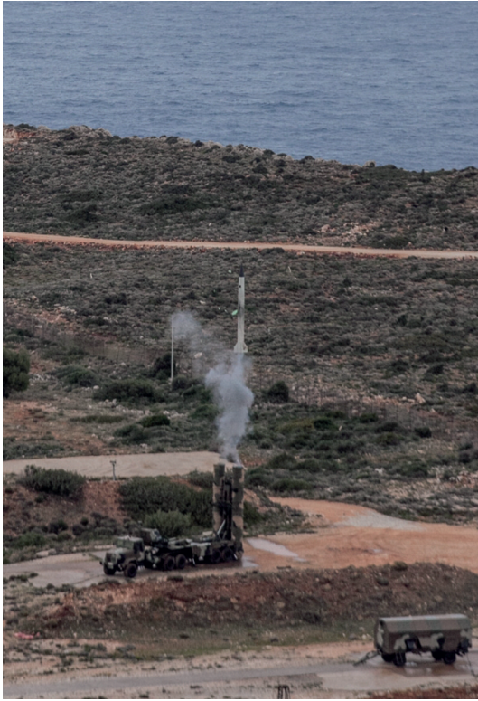
Disparo del sistema S-300 en el polígono NAMFI en Creta.

por la junta militar de Atenas en 1974, Turquía respondió con una invasión. El territorio en manos turcas se convirtió en la República Turca del Norte de Chipre, únicamente reconocida por Turquía, quedando la isla dividida desde entonces (Malinson, 2005: 75-87).