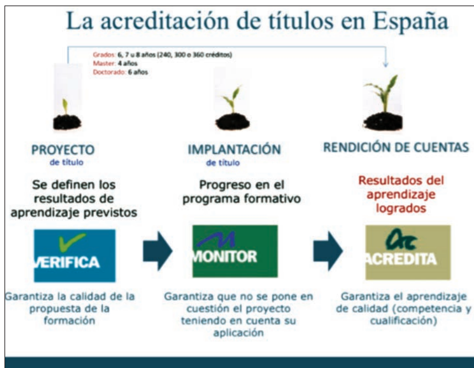
Proceso de acreditación de títulos en España. (ANECA).

respondan a nuestras necesidades, todo ello bajo el paraguas de ANECA (5). Esto nos permitiría no solo impartir el «título» de alférez de navío o teniente, sino también todo un catálogo de estudios que nos capaciten para llegar hasta el nivel más alto, el MECES-4 o título de doctor.