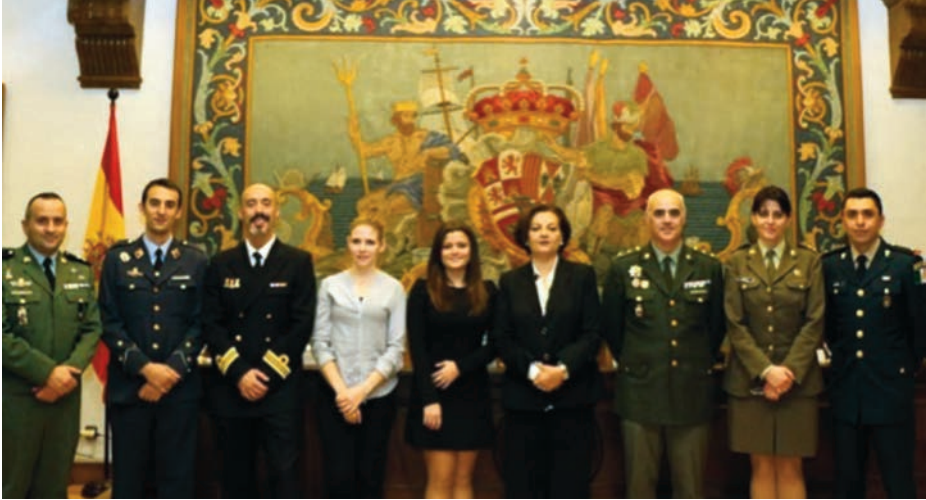
Inauguración de la VI Edición del Máster en Logística y Gestión Económica de la Defensa. ( www.onemagazine.es ).