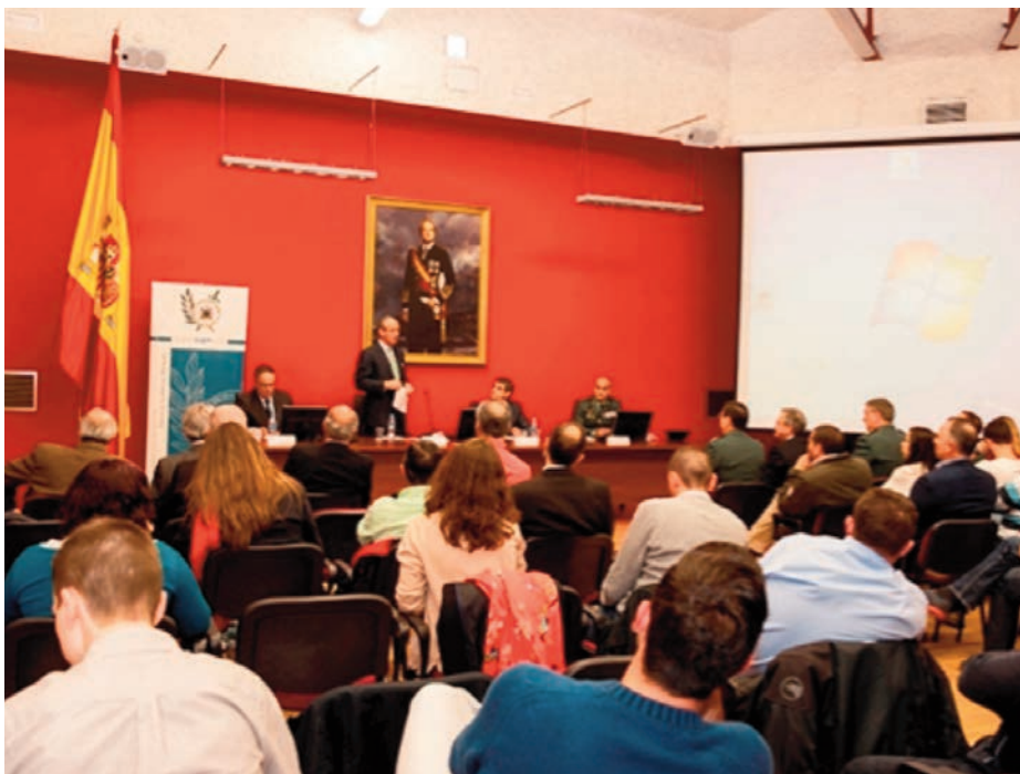
Sede del Instituto Universitario General Gutiérrez Mellado en la calle Princesa en Madrid (UNED).

Estos dos másteres anteriores del IUGM, bajo dependencia de la UNED, junto con los grados que se imparten actualmente en los CUD de Marín, San Javier y Zaragoza, son los únicos títulos relacionados con Defensa que han sido completamente verificados y acreditados por ANECA, es decir, han pasado por sus programas de evaluación o VERIFICA, y seguimiento o MONITOR (ver segunda imagen del artículo).