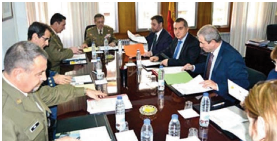
Reunión de la Comisión Mixta de seguimiento del Convenio entre el Ministerio de Defensa (MINISDEF) y el Instituto Aragonés de Empleo (INAEM).

enorme trabajo para la Dirección General de Reclutamiento y Enseñanza Militar, dependiente del Ministerio de Defensa, que les obliga a firmar decenas de convenios diferentes.