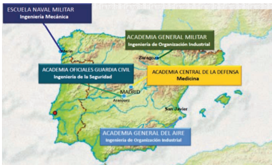
Distribución actual de los CUD en España. (MINISDEF).

La Red de Centros Universitarios de la Defensa, creados por Real Decreto 1723/2008, de 24 de octubre, es un novedoso sistema que nació con el objeti-