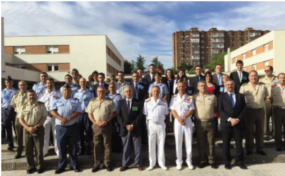
Inauguración del 1.º Máster en Técnicas de Ayuda a la Decisión en los exteriores de la Academia Central de la Defensa (CUD Madrid).

para el desarrollo de las enseñanzas de posgrado relacionadas con los diferentes cursos que imparte la Escuela Superior de las Fuerzas Armadas (6).