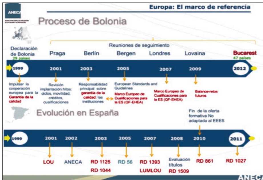
Evolución del Proceso Bolonia en España. (ANECA).

creación de más títulos de grado (2) y de máster (3), denominados también MECES-2 y MECES-3 (4).