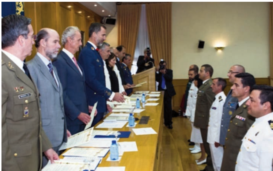
Ceremonia de clausura del XVI Curso de Estado Mayor en el CESEDEN presidida por S. M. el Rey Felipe VI, acompañado por el anterior ministro de Defensa.

servicio público y una tarea en la que todos los españoles deben estar comprometidos.