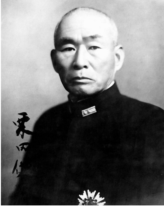
Vicealmirante Takeo Kurita.

formada por dos acorazados, un crucero pesado y cuatro destructores, al mando del vicealmirante Shoji Nishimura, a la que se debían incorporar tres cruceros pesados, ocho ligeros y ocho destructores que, al mando del vicealmirante Kiyohide Shima, habían salido del Japón. Esta segunda fuerza debería cerrar la tenaza desde el sur, de modo que entre Kurita y Nishimura aplastasen a las fuerzas de desembarco. El plan estaba bien diseñado aunque, dada la desproporción de fuerzas, parecía irrealizable; pero a veces la audacia juega a favor del más débil.