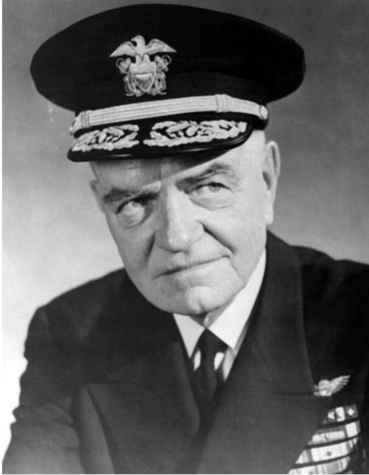
Almirante William Halsey.

caran las lanchas torpederas y destructores, luego los cruceros ligeros y, por fin, la línea de cruceros pesados y acorazados del contralmirante Oldendorf, que cerrarían el paso del Estrecho en la posición de máxima eficacia artillera, es decir, cruzando la T (2).