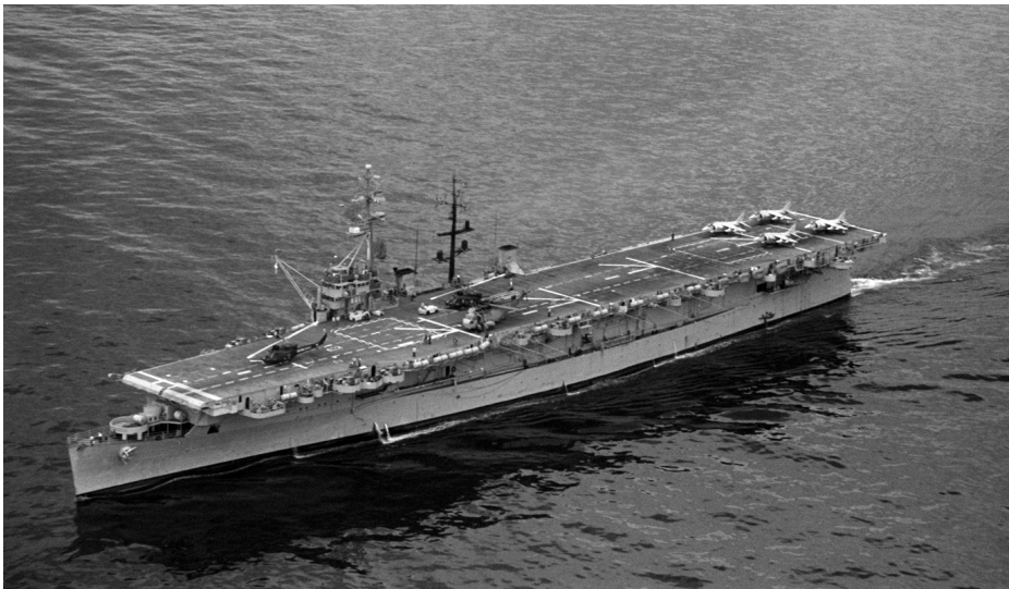
Portaaviones Dédalo .

Las críticas en el lado japonés se centraron en Takeo Kurita, el único almirante que no cumplió su parte en el plan SHO. Fue relevado en el mando y le fue asignado el de la Academia Naval del Japón, lo que hace pensar que salió muy bien parado, tal vez debido a que el propio comandante de la Flota Combinada había cometido el error de utilizar a las nuevas promociones de aviadores navales en las acciones previas al desembarco, con lo que se perdió gran cantidad de aviones y pilotos que hubieran podido prestar cobertura aérea a Kurita. En el bando americano, las críticas de King y Nimitz fueron contra Halsey por haber descuidado la defensa del estrecho de San Bernardino. El grave error de este se hubiera evitado de haber existido un mando único.