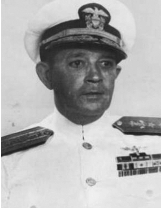
Contralmirante Clifton Sprague.

Taffy-2 se pusieron a las órdenes de Fowler, que pudo coordinar un ataque masivo en el que se lanzaron por lo menos 49 torpedos, y los cazas, bombas y cohetes.