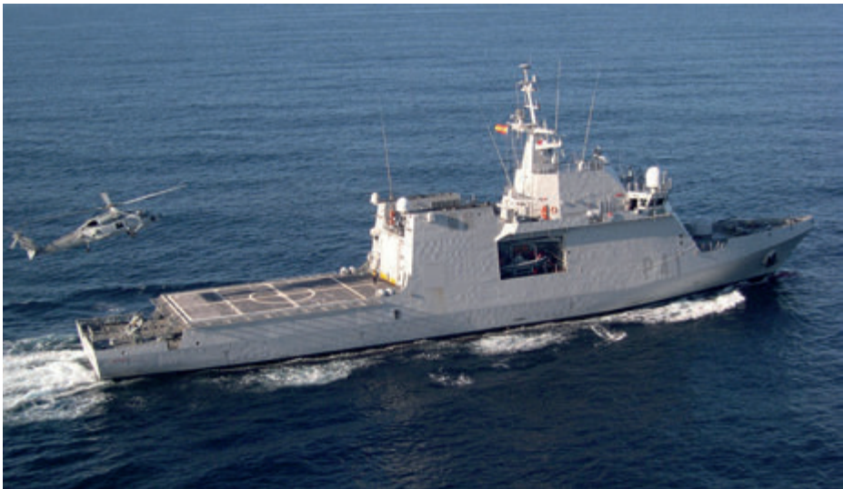
BAM Meteoro . (Foto: www.armada.mde.es ).

Asimismo, hay que destacar que la Armada fue pionera en la construcción de «Buques Contaminación Cero». Esto supone que no llevan amianto, ni pinturas antiincrustantes que incluyan óxido de estaño, ni aceites contaminantes en los transformadores eléctricos, ni gases CFC (cloro-flúor-carbonos) perjudiciales para la capa de ozono, ni gases halones, igualmente perjudiciales para la capa de ozono, en los sistemas contraincendios, y que cuentan con motores eléctricos (POD) que minimizan la generación de CO 2 , causante del efecto invernadero. Estos buques disponen de plantas de tratamiento de aguas residuales, aguas oleosas, trituradoras para los residuos orgánicos, compactadoras para residuos sólidos, etc., y además cuentan con mecanismos de control de residuos contaminantes para eliminar los que otros han vertido incontroladamente.