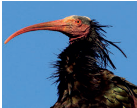
Ibis eremita. (Foto: www.fotonatura.org ).

Como muestra de la importancia concedida a estos asuntos, cabe reseñar que la Marina estadounidense pretende instalar una planta fotovoltaica (diez hectáreas) en la Base Naval de Rota, un proyecto de 28 millones de dólares, con un ahorro previsto de 1,35 millones de euros/año, para cumplir con su