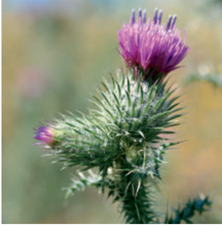
Carduus myriacanthus . (Foto: www.wikipedia.org ).