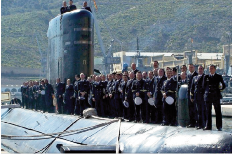
Dotación del submarino.

horas de sueño es mucho menor de seis; es un horario complejo que día a día te va restando horas de descanso: guardia-comida-dormida.