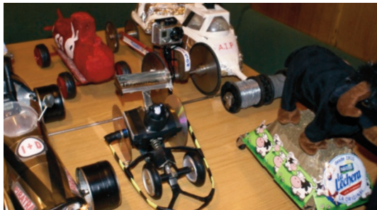
Vehículos de carrera.

El día a día como marineros se lleva montando vigilancias en nuestros puestos, con turnos fijos de comida, en los que nos juntamos el personal de la misma categoría, y el descanso entre vigilancias.»