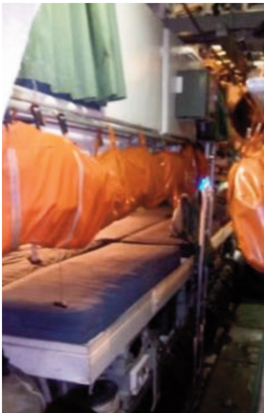
Alojamiento cámara de proa.

En todas las marinas ha existido siempre una duda con la incorporación de la mujer en el ámbito de submarinos, un arma considerada tradicionalmente masculina. Aunque poco a poco su presencia se ha ido tomando como algo normal, ha constituido uno de los cambios más importantes acaecidos en las organizaciones militares contemporáneas.