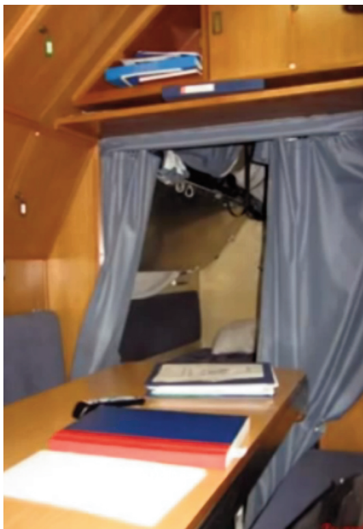
Cámara de Suboficiales.

La voz del jefe de cámara se escucha y, aunque de vez en cuando no se entiende, se respeta y se acata. Aun no siendo el de mayor edad, pero sí el de mayor graduación, es nuestra punta de lanza, creando buen ambiente, solventando pequeños errores de cortesía y auxiliando al segundo comandante en todo lo que estime oportuno. El jefe de cámara posee una musculatura intelectual, integridad y preparación para cumplir cualquier misión que sea requerida, apoyándose en los suboficiales de cargo, los cuales filtran y facilitan la cadena de mando para organizar la rutina diaria.