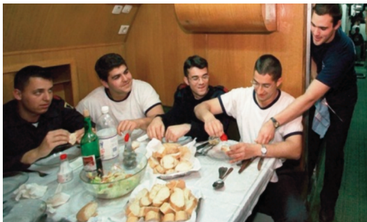
Comedor de marinería.

— Un alojamiento para la dotación con 14 literas permanentes.