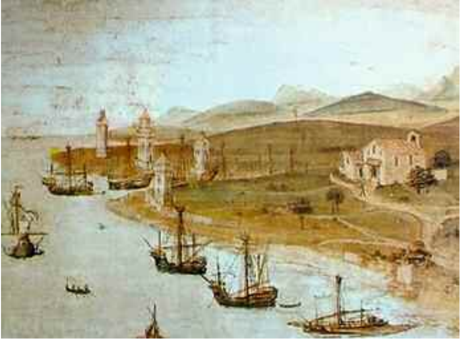
Detalle de la pintura de De Pere Niçard, siglo xv. (Museo Diocesano de Palma).

de dos mil libras», logrando finalmente los defensores del colegio fondos para el sostenimiento del muelle y para el mantenimiento de las torres.