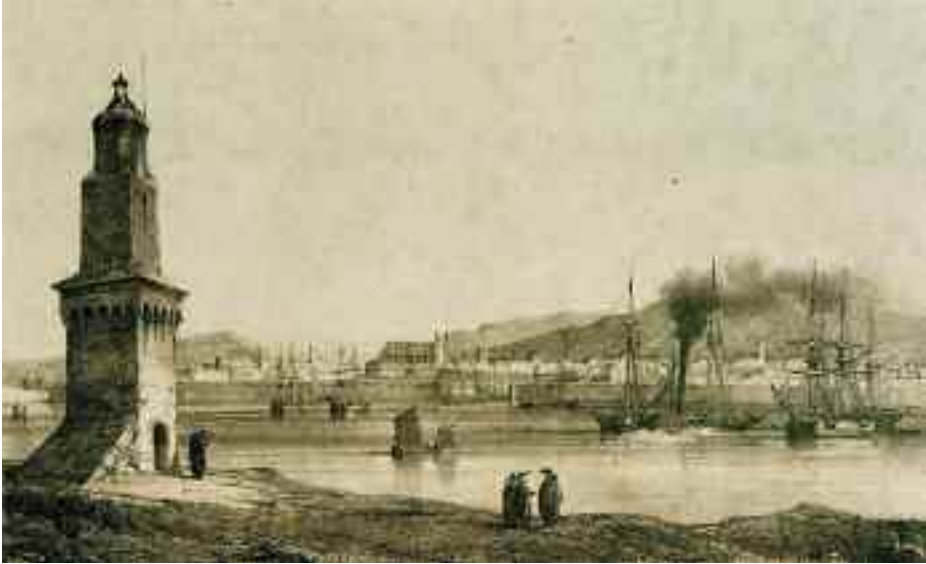
Grabado del siglo XIX, panorámica de la Torre y bahía de Palma.

como base para sus acciones guerreras y comerciales, iniciándose un intenso tráfico de embarcaciones que alcanzó su mayor apogeo cuando el rey Jaime I el Conquistador rescató la isla de un largo periodo de dominación berberisca.