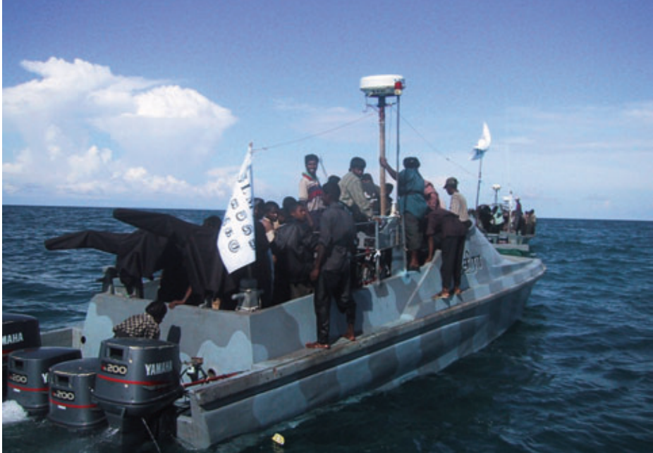
Embarcaciones de los Tigres del Mar efectuando transporte de personal.

contrabando de armas cuando un patrullero se acercaba a investigarlo (5). Además, disponían de buceadores adiestrados en la colocación de minas bajo el agua, que operaban con embarcaciones semisumergibles, y que en 2008, ya casi al final del conflicto, hundieron un patrullero y un buque logístico.