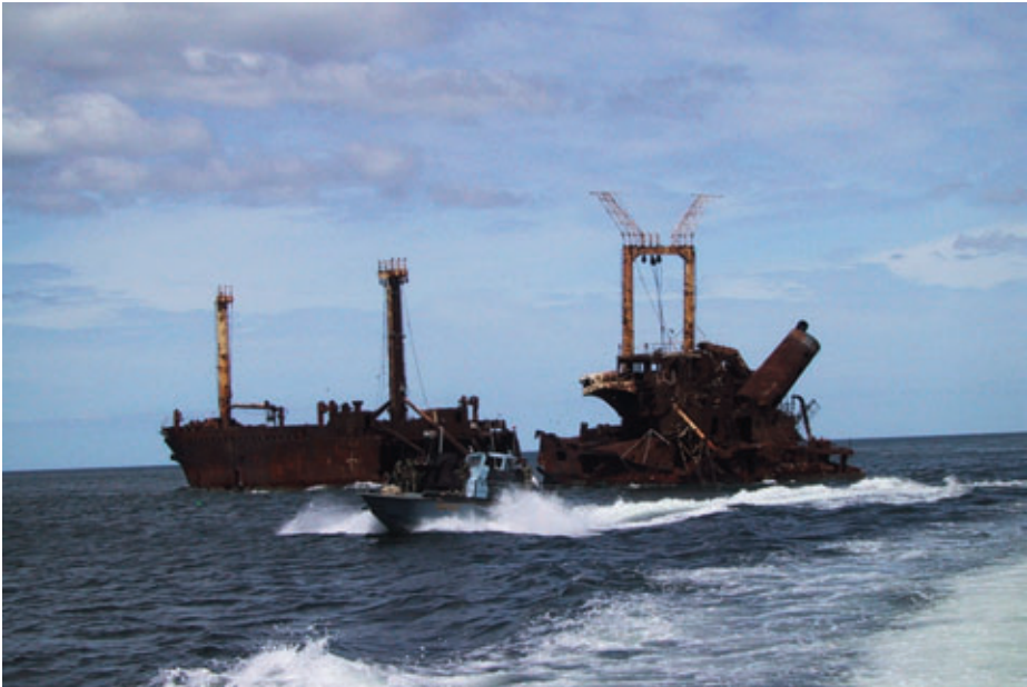
Una embarcación armada de los Tigres del Mar navegando próxima a un mercante de dicho grupo destruido por la aviación de Sri Lanka. (Autor: Isak Berntsen).

Entre las acciones del grupo se cuentan ataques contra los buques y el personal de las compañías petrolíferas extranjeras radicadas en la zona, como