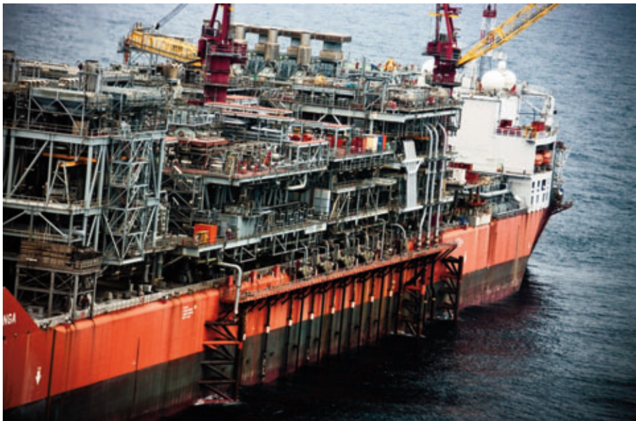
La instalación petrolífera Bonga , situada a 60 millas de la costa de Nigeria, atacada por el MEND el 19 de junio de 2008.

producción en alrededor de 300.000 barriles diarios, lo que contribuyó al alza de los precios mundiales del petróleo. La amnistía anunciada el 25 de junio de 2009 por el presidente de Nigeria, que fue aceptada por algunos líderes del MEND, tuvo visos de alcanzar el éxito al declarar el grupo un alto el fuego el 25 de octubre de ese año. Sin embargo, volvió a reanudar sus actividades el 19 de diciembre siguiente, cuando cinco embarcaciones tripuladas por 35 de sus miembros, armados con lanzacohetes, ametralladoras y fusiles de asalto, atacaron un oleoducto operado por las compañías Chevron y Shell a la altura de la localidad de Abonamo, en el sur de Nigeria. El grupo pretendía así mostrar tanto la incapacidad del gobierno para mantener el sur del país bajo control como su propio compromiso para continuar con lo que proclama como una lucha por la tierra y los derechos del pueblo del delta del Níger, que según él ha sido víctima de robo durante 50 años. Aunque declaró seguir abierto a la posibilidad de diálogo, el 29 de enero de 2010 notificó la finalización del alto el fuego y amenazó a las compañías petrolíferas con ataques indiscriminados contra sus instalaciones y personal. Durante el mes de noviembre de 2010, reivindicó dos ataques contra plataformas offshore en los que, además de detonar explosivos colocados en ellas, secuestró a siete ciudadanos nigerianos y otros tantos extranjeros.