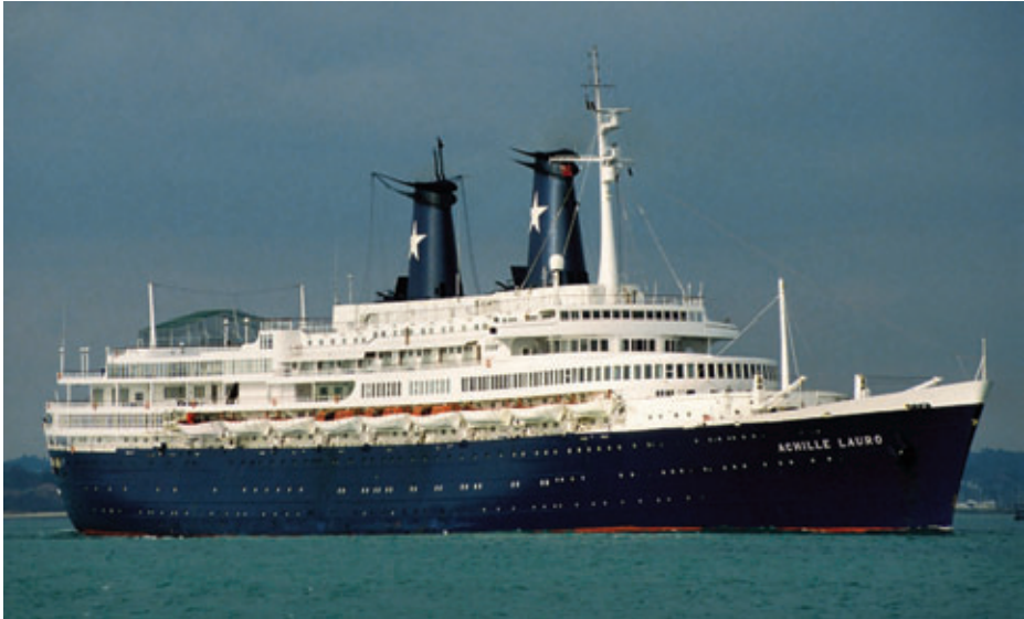
El Achille Lauro , secuestrado por terroristas del FLP, en octubre de 1985.

puestos a disposición de la OLP. Cuando el avión 737 de Egypt Air en el que volaban, acompañados por Abu Abbas, se dirigía hacia Túnez, fue interceptado por aviones F-14 del portaaviones USS Saratoga y obligado a tomar en la base aeronaval de Sigonella, en Sicilia. Los terroristas responsables del secuestro fueron juzgados en Italia. Abu Abbas fue puesto en libertad por falta de pruebas, aunque posteriormente sería juzgado por rebeldía por un tribunal italiano, que le condenó a cadena perpetua (6).