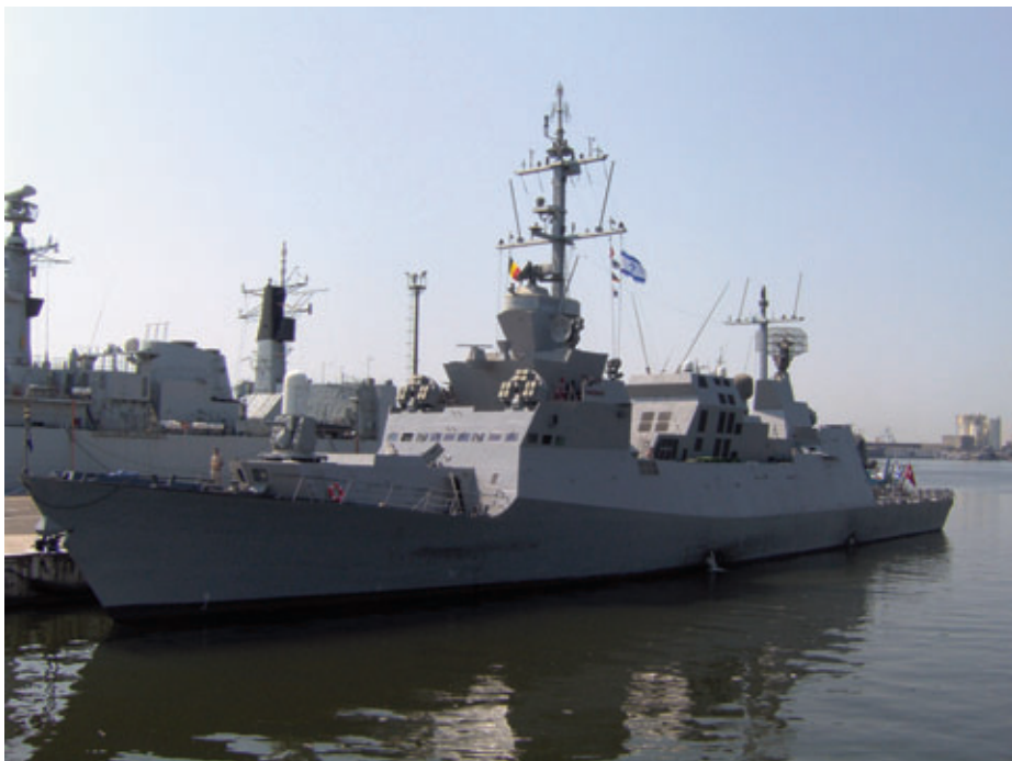
Corbeta isrelí Eilat , primera de la serie a la que pertenece la Hanit.

En los primeros meses de 2011 el grupo amenazó con nuevos ataques contra instalaciones petrolíferas y el 16 de marzo hizo estallar varias bombas en estaciones de bombeo de la compañía Agip en el delta del Níger. El 12 de agosto volvió a amenazar con acciones contra las petroleras y acusó a Shell de complicidad en la destrucción medioambiental en la región.