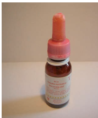
Figura 2. Envase deteriorado.

Los resultados reflejados en la tabla 2 muestran valores similares y acordes a las especificaciones establecidas para el producto (uniformidad de volumen, densidad, pH y valoración), tanto para cada uno de los lotes, considerado individualmente (medidas de dispersión reducidas), como en los diferentes lotes entre sí (medidas de centralización y dispersión similares).