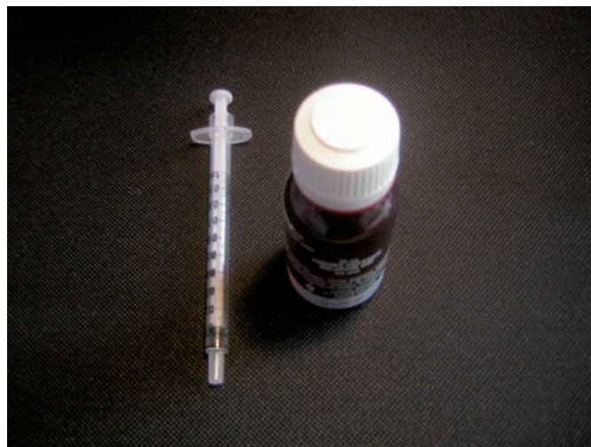
Figura 3. Nuevo envase y dosificador.

Si bien los valores correspondientes a las soluciones almacenadas durante cuatro años, presentan una pérdida en la especificación