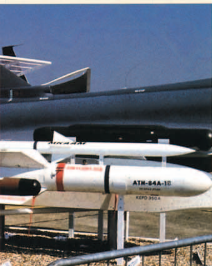
en el Salón de Le Bourget.