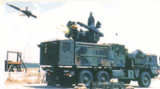
Roland, de dotación en la Luftwaffe alemana.

Según Alan Garwood, Vicepresidente ejecutivo del grupo Meteor, el anuncio de que los Estados Unidos aceptarían "en principio" las exportaciones del FMRAAM representa un punto de vista inaceptable para los gobiernos europeos. "Antes, Europa era libre de elegir lo que quisiera, pero atada al FMRAAM, tendrá que pedir permiso a los americanos para exportar el misil y sus derivados". Para aquellos que quieran "especular" sobre la posible decisión británica, hay que resaltar que la participación británica en el proyecto FMRAAM supera el 50%.