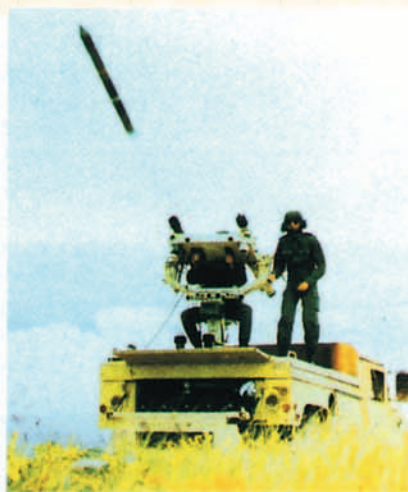
Puesto de tiro Atlas con Mistral, en servicio en la Fuerza Aérea belga y en el Ejército del Aire.

THOMSON-CSF planteó la configuración integrada compuesta por radar RAC-3D (no presente en el Salón), Centro de Control Antiaéreo (AACC), Crotale NG (Nueva Generación) con misiles VTI y Unidad de Fuego automática ASPIC, la