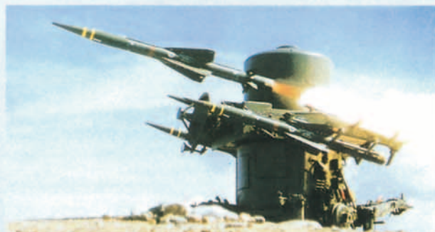
Rapier, en servicio en la RAF británica.

• Se hace especial hincapié en la estructura de mando y control, efectuando la presentación de sistemas integrados de corto y muy corto alcance en diferentes configuraciones, con soluciones diversas de mercado que responden al concepto de integración de los diferentes subsistemas bajo un centro de control único y en el escalón superior de la defensa aérea con intercambio por protocolos normalizados de la situación aérea, identificación, asignación de trazas para su empeño y otras órdenes tácticas.