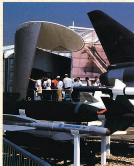
Iris T y AMRAAM, mostrados junto al EF2000

sil aire-aire de nueva generación y alcance "medio" (los alcances "medios" previstos bien podrían ser "grandes" alcances en la actualidad). El hecho de que la decisión británica sea la primera en hacerse pública (se espera antes de fin de 1.999) puede tener una gran influencia en las decisiones que más tarde deberán tomar el resto de países del consorcio Eurofighter. Por este motivo, la competencia entre los dos grupos que optan a la adjudicación del BVRAAM (Raytheon y el grupo Meteor) está alcanzando un gran nivel y no faltan declaraciones y acusaciones cruzadas en el juego de "llevarse el gato al agua".