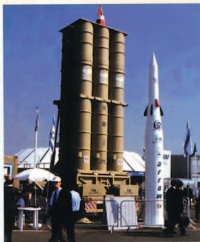
Arrow, en inventario de la Fuerza Aérea israelí.

• El consorcio formado por la compañía estadounidense RAYTHEON y la noruega KONSBERG presenta el sistema NASAMS (Norwegian Advanced Surface to Air Missile) cuya configuración básica está formada por centro de distribución de fuegos, radar multifunción Setinel AN-MPQ 64, sensor de seguimiento optrónico y lanzador de misiles activos AMRAAM. El lanzador se presenta en dos versiones: la de RAYTHEON, con una adaptación de los lanzadores de misiles semiactivos Hawk, y lo de Konsberg, con lanzadores dotados de celdas-contenedores.