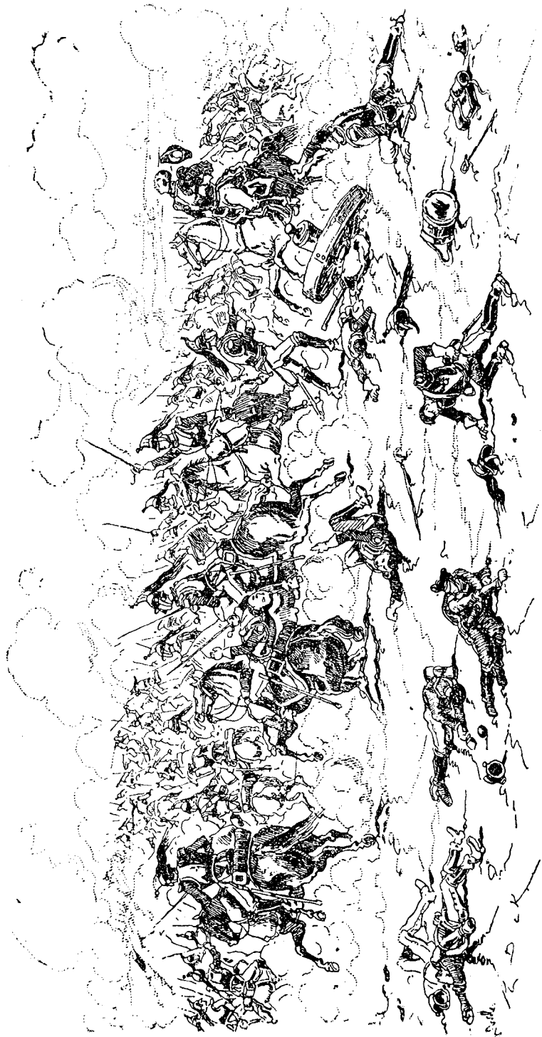
Los coraceros franceses entran en acción (Grabado de la época reproducido de la revista inglesa «Tradición», núm. 13).