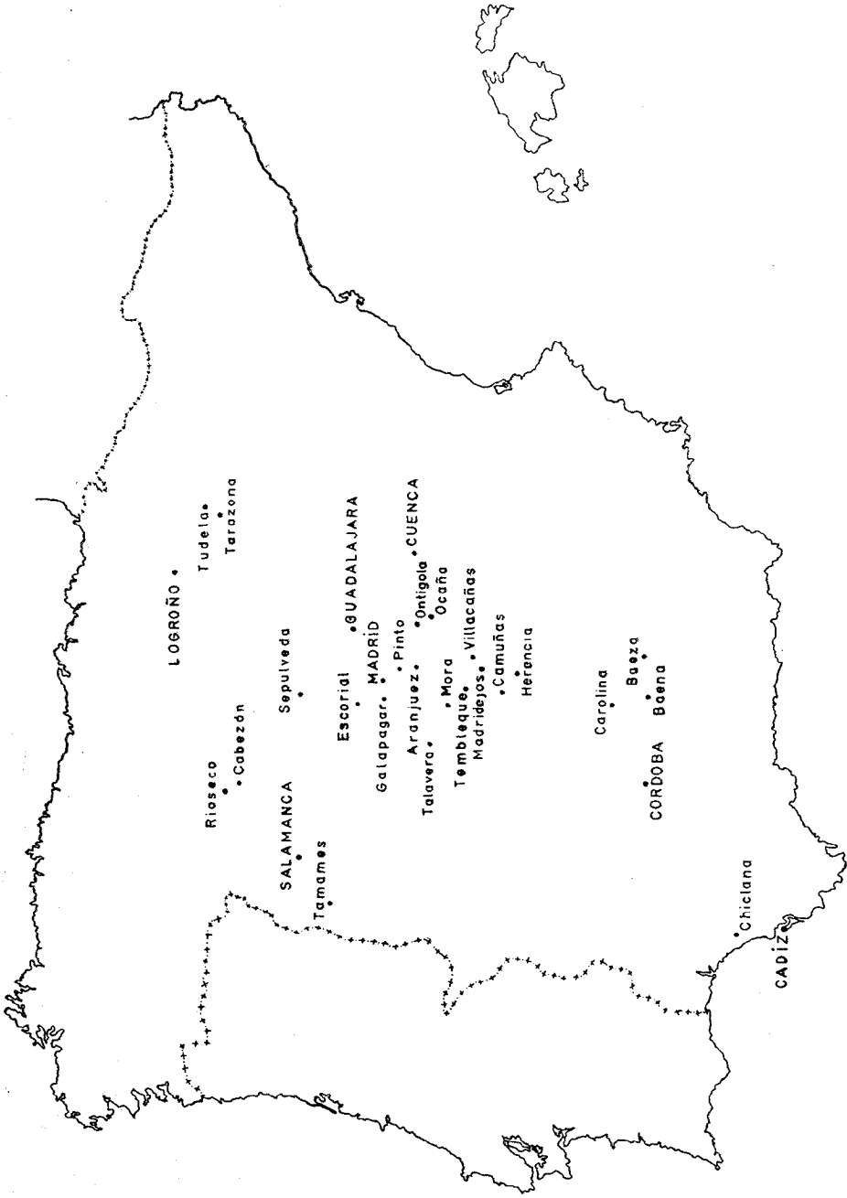
Puntos del itinerario militar de don Angel de Saavedra, en los años 1808 y 1809.