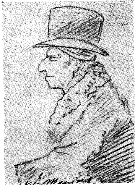
Curioso retrato de D. Jerónimo Merino, obra de Luis López, hijo del famoso D. Vicente López El dibujo, hecho con lápiz negro, en 1823. La inscripción «El cura Merino» que figura en tinta al pie, es autógrafa del dibujante. Reproducción al tamaño del original