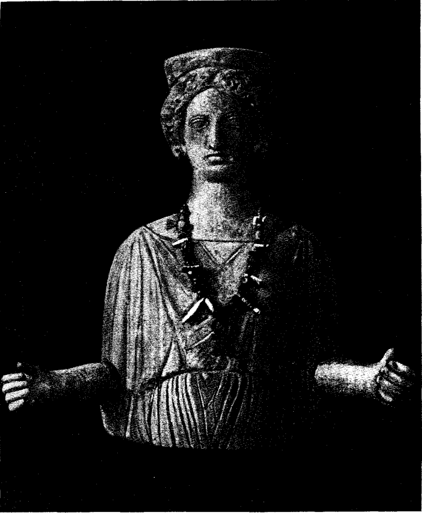
Cultura cartaginesa. Estatuilla de tierra cocida, encontrada en la necrópolis de Puig de Molins (Ibiza). Arte helenizante.