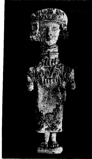
Cultura cartaginesa. Arriba, figuritas de barro, representando ídolos, muy propias del tosco arte cartaginés. Abajo, dos ánforas, que denotan una clara influencia fenicia.