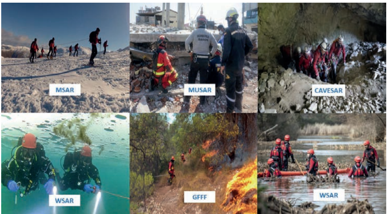
Especialidades centralizadas de la UME ofertadas internacionalmente.

La UME dispone de una serie de capacidades que están ofrecidas internacionalmente, ya sea a través del mecanismo de protección civil de la Unión Europea (EUCPM), del