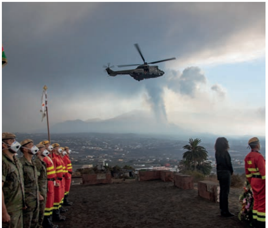
Homenaje el día de Todos los Santos en La Palma.

El domingo 19 de septiembre, a las 16:12 hora peninsular, todos pudimos ver en directo el inicio de la erupción del volcán de Cumbre Vieja. Esa misma noche llegaron a La Palma por vía marítima 123 miembros de la UME de la UIEM Canarias, con despliegue permanente en Tenerife Norte y Gando, con 67 medios, entre ellos 12 autobombas y cuatro camiones nodriza. A estos se añadiría un puesto de mando y el personal necesario para mantener los elementos de intervención en Tenerife y Gando, procedentes del BIEM II (base aérea de Morón). Esta rápida respuesta fue posible gracias al transporte proporcionado por el Ejército del Aire con un avión T-23, así como de todos los medios de ala fija o ala rotatoria desplegados en Gando, para los desplazamientos inter islas. Procedente de la península y por vía marítima, también se incorporó el vehículo ligero de reconocimiento (VELIRE) con capacidad de detección remota NRBQ y COLPRO, dándose también