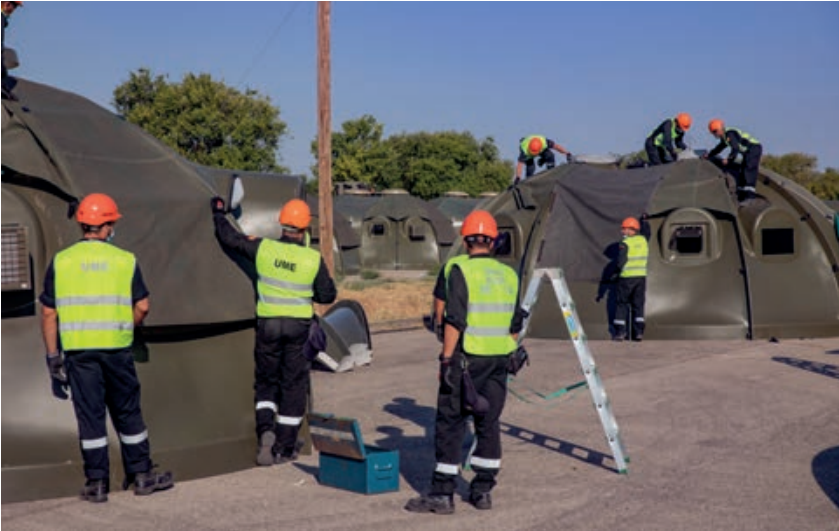
Instalación provisional de tránsito.

vacunaciones, las coordinaciones en el ámbito logístico y económico, así como la preparación de los medios CIS que aseguren el enlace entre UMEDAT y JOC.