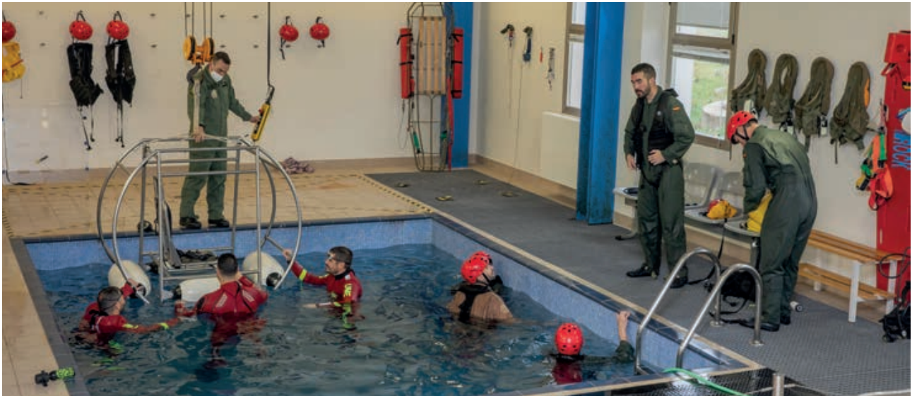
Apoyo con personal de rescate en entrenamiento en el CIMA.

o la hostelería y alimentación. También se recibe formación en áreas tan especializadas como el análisis forense o el curso NRBQ del EdA, o incluso el curso de psicología aeronáutica. Y teniendo en cuenta que la UME se encuentra desplegada en cuatro bases aéreas, resultan imprescindibles los conocimientos en asesoría y auditoría ambiental en Ejército del Aire.