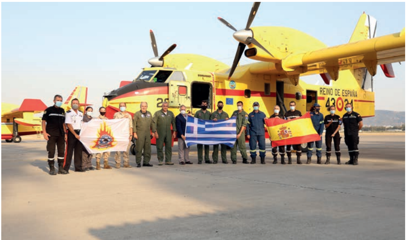
Despliegue lucha contra incendios forestales en Grecia.

en el plazo de una hora y el equipo UMEDAT nombrado al efecto, que se encuentra alertado todo el año a un NTM de tres horas, no solo para este tipo de misión, sino también para las diferentes capacidades de búsqueda y rescate y lucha contra incendios que la UME tiene ofertadas a organizaciones internacionales. Desde la UME se establece el contacto previo con autoridades y organismos de la zona de la emergencia, como la Agregaría de Defensa y las autoridades de Protección Civil de la nación anfitriona, incluyendo a la autoridad local de la emergencia (LEMA), así como con otras agencias y organizaciones internacionales con las que se tenga previsto colaborar. Mientras se elaboran los diferentes formularios requeridos en la plataforma del Sistema Común de Comunicaciones e Información en Emergencias (CECIS) de la Unión Europea, también se realizan los reconocimientos médicos previos al despliegue y las posibles