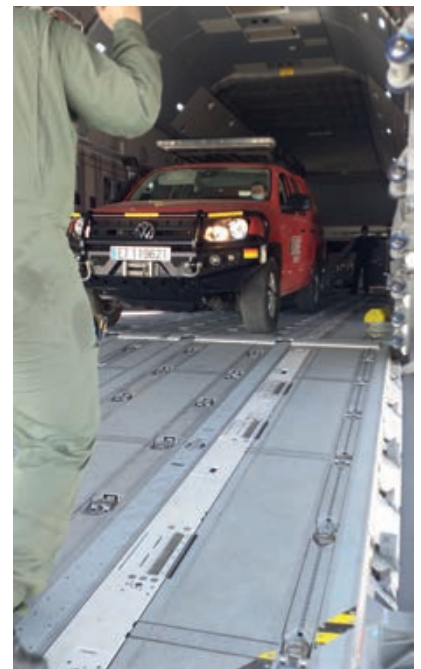
Carga de vehículo Amarok UME en A400M.

Pero no podíamos despedir el año sin añadir una nueva colaboración en los últimos días de diciembre, trabajando codo con codo con el personal del EVA-12 en Espinosa de