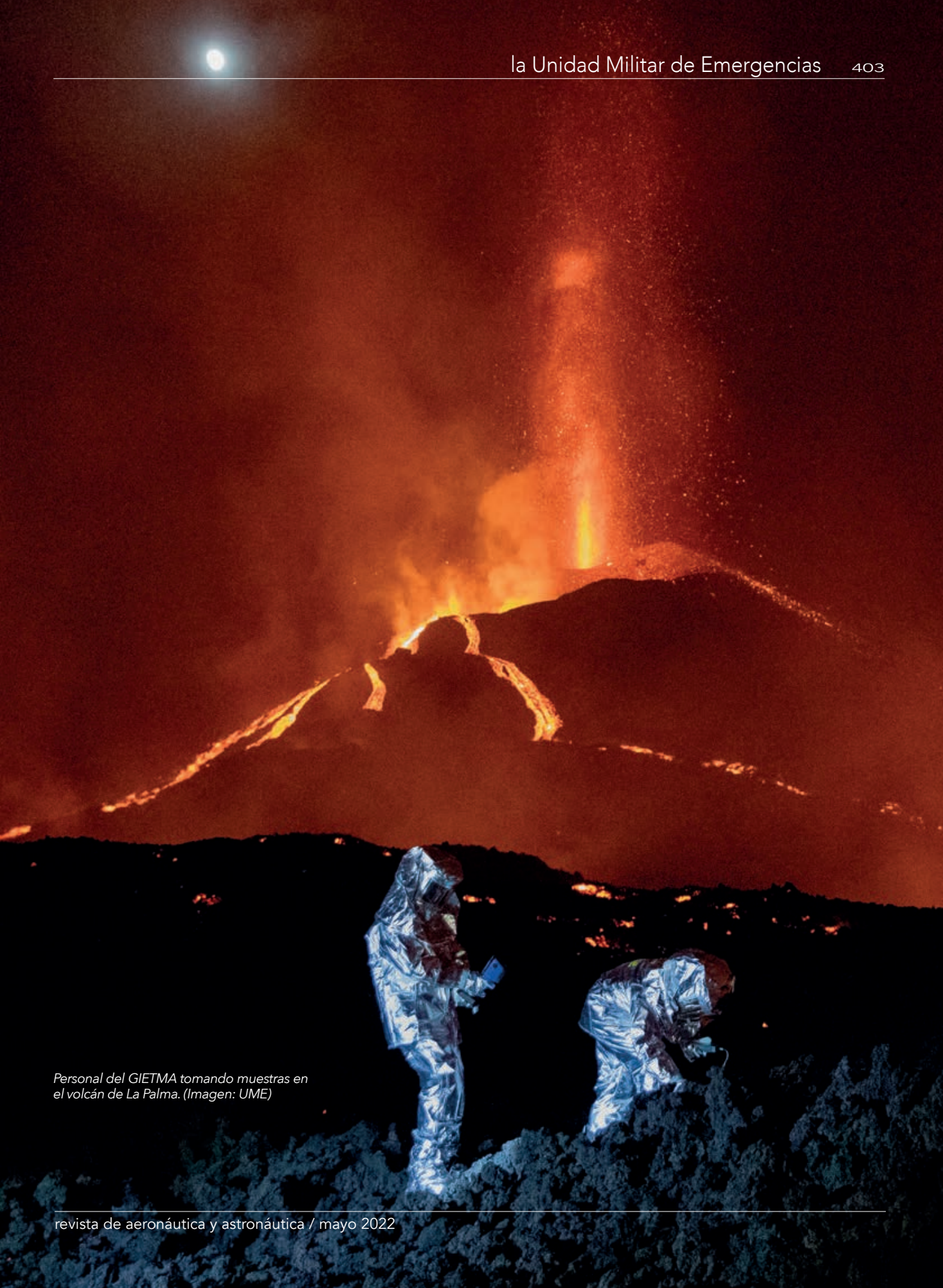
Personal del GIETMA tomando muestras en el volcán de La Palma.