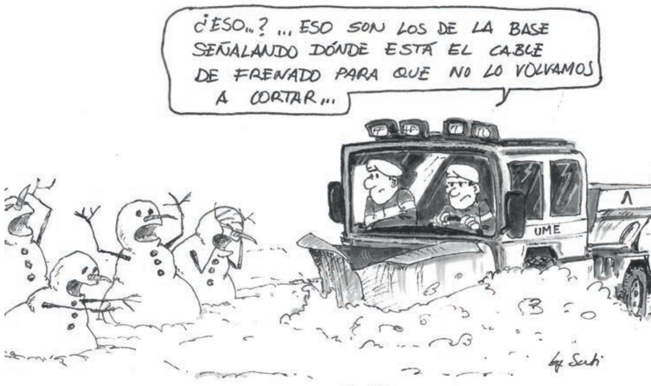
Retirada de nieve en la base aérea de Getafe (Caricatura del coronel Ibarreta)

Como ya se ha mencionado, no habían finalizado las vacaciones de Navidad para muchos cuando la Agencia Estatal de Meteorología (AEMET) avisó de la llegada de la borrasca Filomena, activándose el Plan Estatal General de Emergencias (PLEGEM) en pre emergencia y convocándose la reunión del Comité Estatal de Coordinación y Dirección (CECOD). Con las previsiones meteorológicas empeorando primero por el sureste peninsular, el general jefe de la UME decidió el despliegue adelantado de medios del primer Batallón de Intervención en Emergencias (BIEM I) desde la base aérea de Torrejón hacia esa zona, así