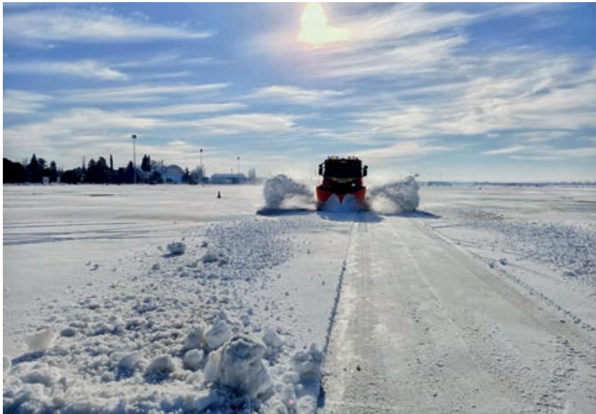
Retirada de nieve en base aérea de Torrejón durante la borrasca Filomena.

como posicionar más cerca de Madrid medios del BIEM V de la base militar Conde de Gazola (León) con el objeto de ganar tiempo en los desplazamientos y, más importante aún, evitar quedar atrapados en carreteras principales colapsadas. Para este despliegue se contó con la ayuda y cooperación de la base aérea de Los Llanos (Albacete), que proporcionó instalaciones para la llegada del material, mientras que el alojamiento y manutención para el personal se realizó en las instalaciones del TLP.