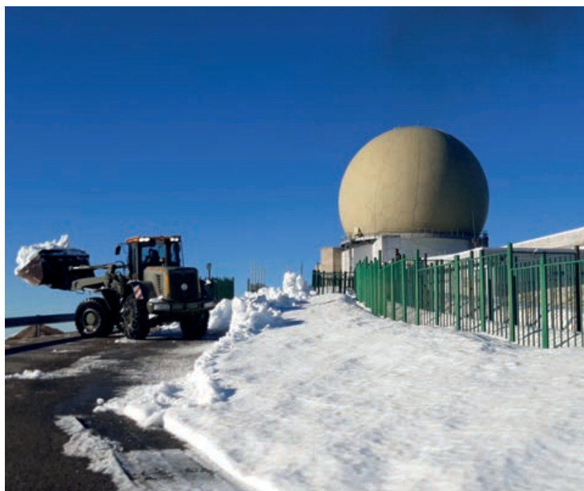
Limpeza de viales de acceso al EVA-12.

Desde la UME seguiremos cumpliendo con nuestra misión y cualquier otra que el mando estime oportuna para salvaguardar la seguridad y el bienestar de todos los españoles. ■