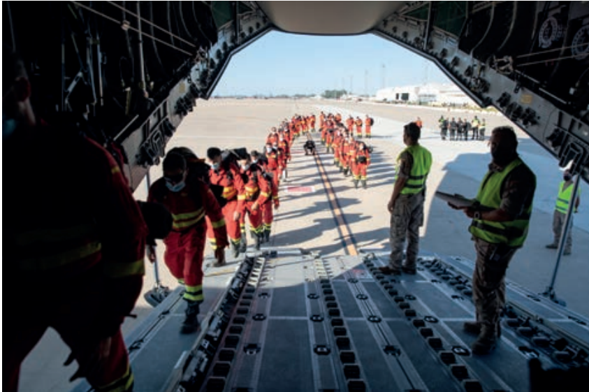
Embarque de personal de la UME en A400M de BAMO hacia La Palma.

de la UME, cuya ficha de validación A400M NOVAL T-23-1019 se había realizado hacía menos de un año. El jefe del EADA consultó con el jefe del BIEM IV (base aérea de Zaragoza) la posibilidad de utilizar dos vehículos de la UME para esta misión, a lo que se respondió de inmediato con el visto bueno del comandante del Mando de Operaciones (CMOPS), aun sabiendo que dichos vehículos muy probablemente no regresarían a territorio nacional, pero harían una gran labor en beneficio de la misión de evacuación.