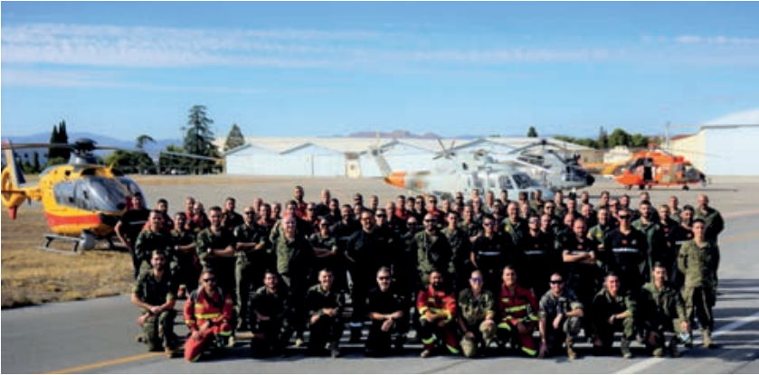
Participantes en el Ejercicio Fénix-Camello en base aérea de Armilla.

Grupo Asesor Internacional de Operaciones de Búsqueda y Rescate (INSARAG) bajo el paraguas legal de Naciones Unidas, el Centro Coordinador Euro-Atlántico de Respuesta en Desastres de la OTAN (EADRCC) o acuerdos bilaterales. Estas capacidades van desde la búsqueda y rescate urbano de tamaño medio (MUSAR), a la búsqueda y rescate en montaña (MSAR), en espacios naturales confinados (CAVESAR) o acuática (WSAR), ya sea en superficie o búsqueda subacuática, así como un módulo ligero de lucha terrestre contra incendios forestales (GFFF) y un módulo RPAS. Estos medios están disponibles para su despliegue internacional inmediato durante todos los días del año, con una rotación mensual entre los batallones que disponen de cada capacidad específica. Adicionalmente, existe un servicio permanente en el cuartel general de la UME para conformar los equipos de apoyo UMEDAT acordes a la emergencia. Pero la rapidez y el éxito de estos despliegues siempre dependerán del apoyo del Ejército del Aire, que proporciona los medios aéreos para el traslado desde territorio nacional a la zona de emergencia. Y para que el embarque sea posible, el Ejército del Aire también nombra el servicio mensual de un equipo del EADA para actuar como SATRA, en el caso de que el despliegue corresponda a alguno de los batallones no