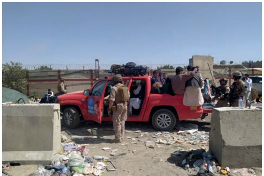
Personal del EADA en Kabul utilizando un vehículo de la UME.

Pero no fue esta la única participación de la UME en la operación de evacuación de personal afgano. No es muy conocido que medios de la UME viajaron hasta Kabul para participar en la misión NEO. Durante la primera rotación en Kabul, el personal del Escuadrón de Apoyo al Despliegue Aéreo (EADA) se dio cuenta de la necesidad de disponer de medios de transporte en el aeropuerto iraquí. La solución más rápida pasaba por trasladar dos vehículos desde Zaragoza a Kabul en la siguiente rotación de un A400M (T-23), estando disponibles en esa misma base los vehículos Volkswagen AMAROK