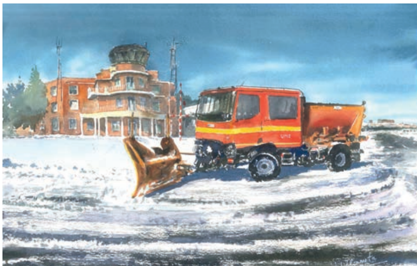
Retirada de nieve en la base aérea de Getafe durante la borrasca Filomena.

que la UME por sí misma sería incapaz de acometer todas las misiones sin los apoyos continuos que recibe por parte de los Ejércitos y la Armada. Sin olvidar, que son las bases del Ejército de Tierra y del Ejército del Aire las que acogen a todas las